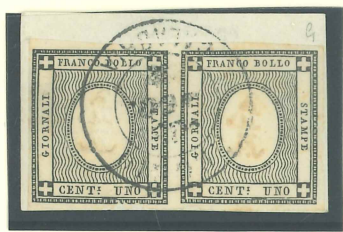
Biondi S 13