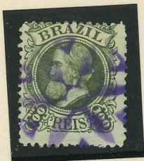
Carimbo em rosácea em cor violeta. PA 783