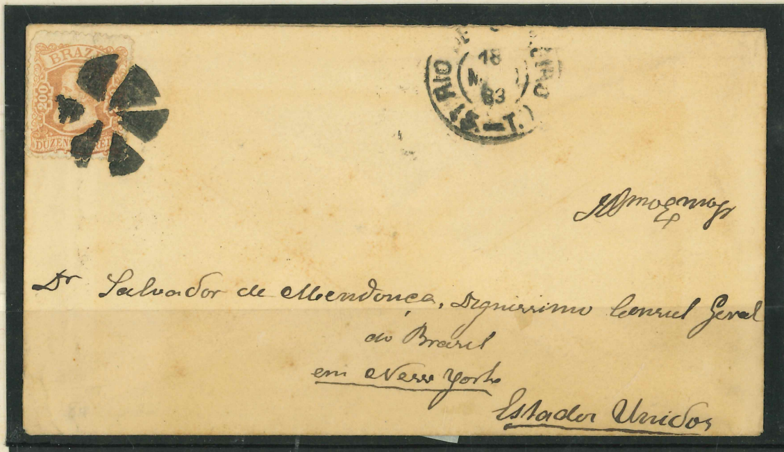
Carta do Rio de Janeiro dirigida ao Cônsul-Geral do Brasil em N.York, Salvador de Mendonça. Carimbo mudo, "Rio de Janeiro 18 ? 83" e no verso "NEW YORK JUN 12 PAID ALL"