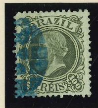
Carimbo em pontos irregulares, em cor azul