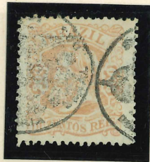
Carimbo oficial PA 1639