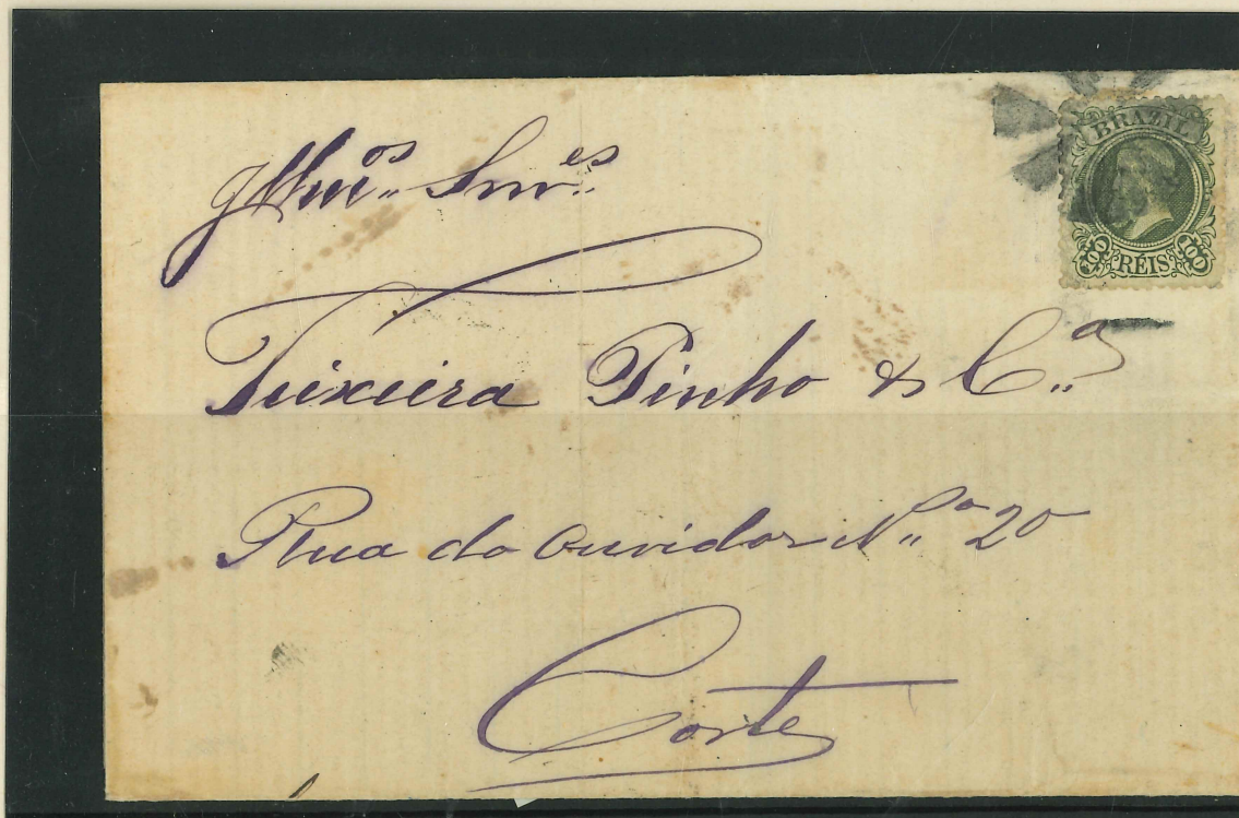
Carta dobrada de Rio Bonito (?) para o Rio de Janeiro, franqueada com selo de 100 Rêis obliterado por carimbo mudo em cunhas concêntricas. No verso, carimbos "Rio Bonito 19 Jan 82" e Rio de Janeiro 20 Jan 82".