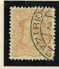
Rio de Janeiro 4a Seção, Tarde