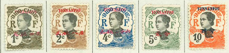
1908. — Timbres d'Indochine de 1907 (Centre noir) avec YUNNANFOU et valeur en monnaie chinoise en surcharge.