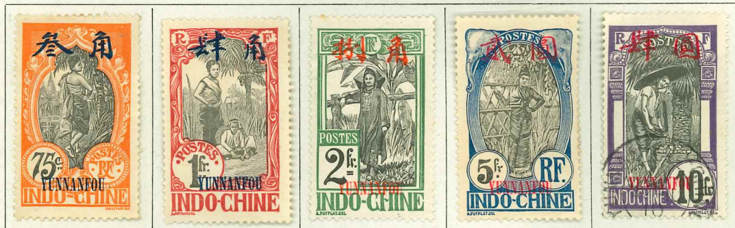
1919. — Timbres d'Indochine de 1919 avec les mêmes surcharges.