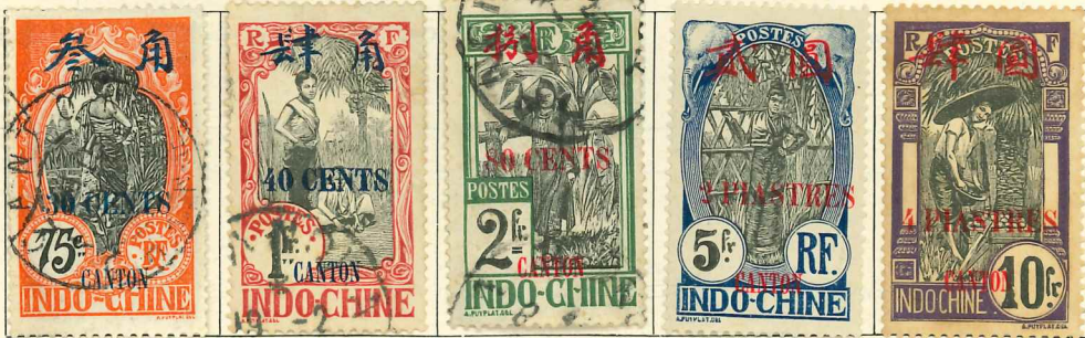
Orange (in blue)

With CANTON and Chinese characters (various) above