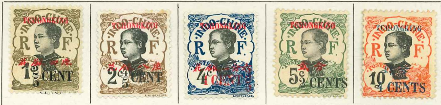
1919. — Timbres d'Indochine de 1919 avec les mêmes surcharges.