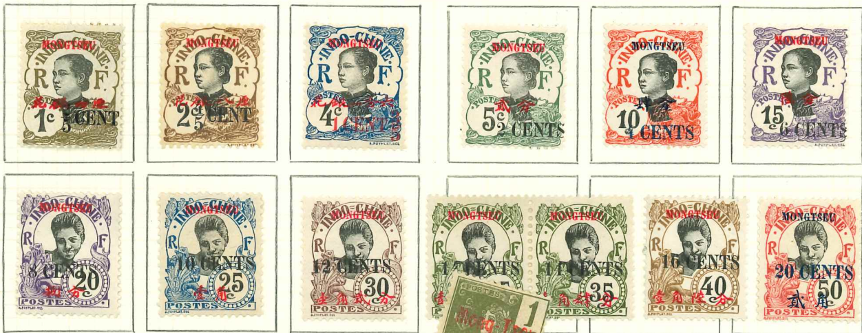
1919. — Timbres de 1908 avec nouvelle valeur en surcharge.