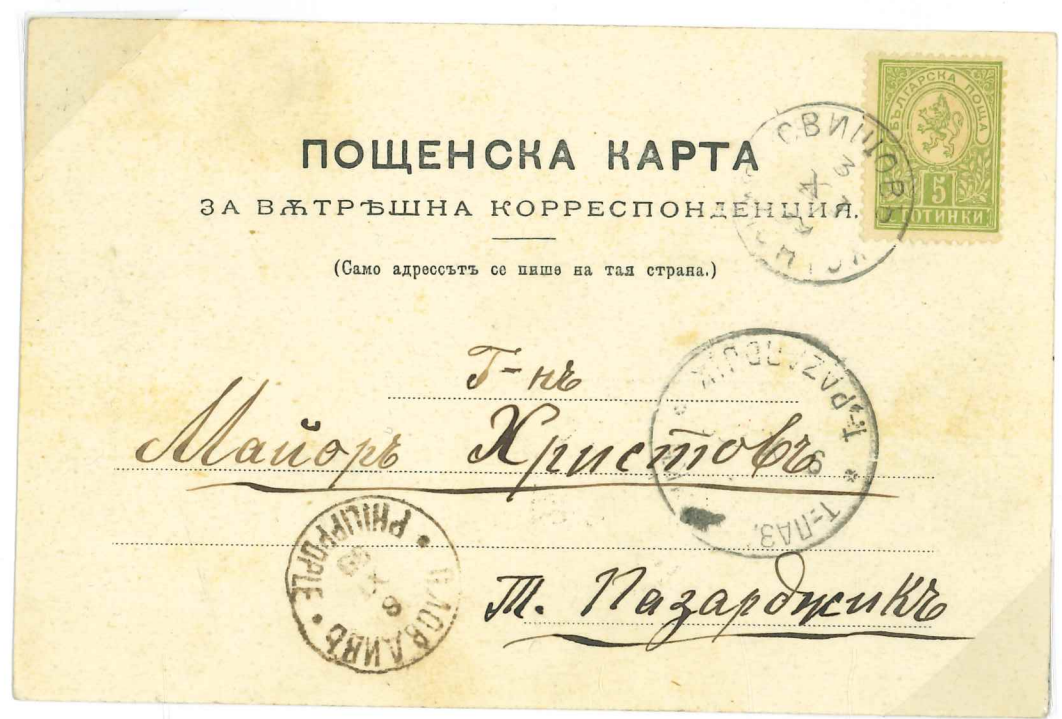
(12) Postkarte 5 St Kleiner Löwe aus Svischtov 3/X/99 via Plovdiv 8/X nach Tatar Pazardjik 9.X.899:

6. AUSGABE INLANDS POSTKARTE VORGEDRUCKT OHNE GANZESUCHEN EINDRUCK