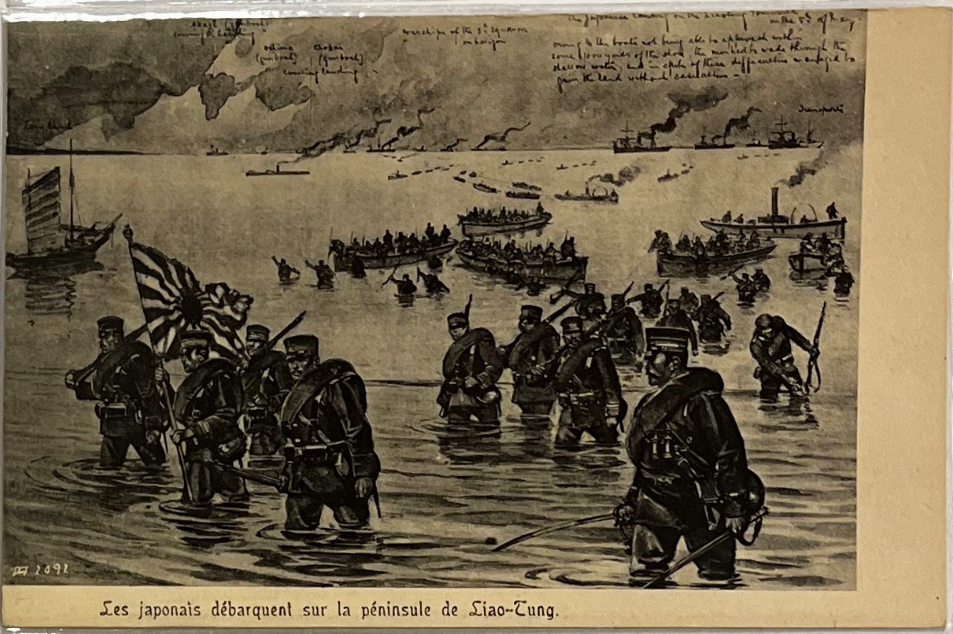
Les japonais débarquent sur la péninsule de Liao-Tung.