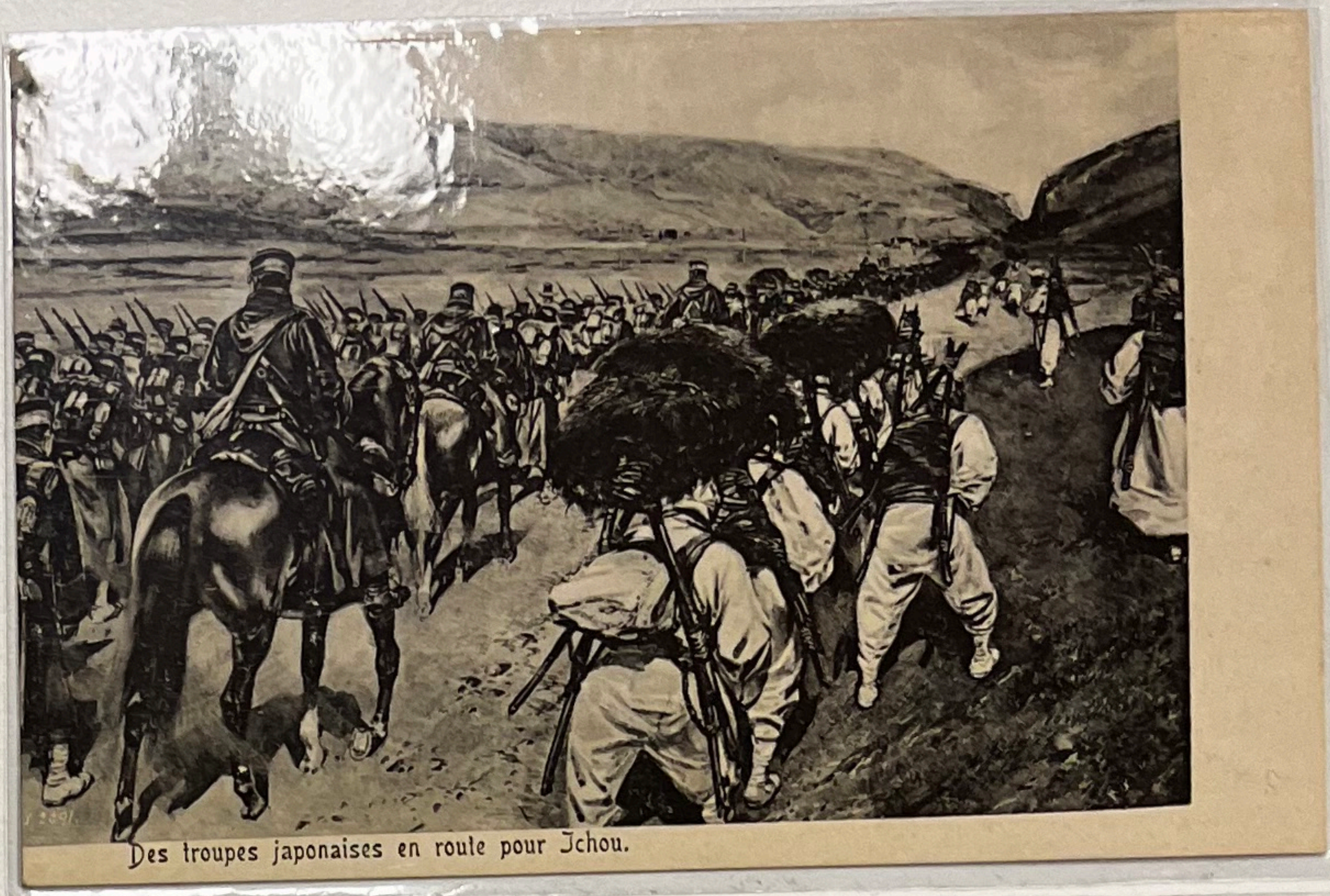
Des troupes japonaises en route pour Tchou.