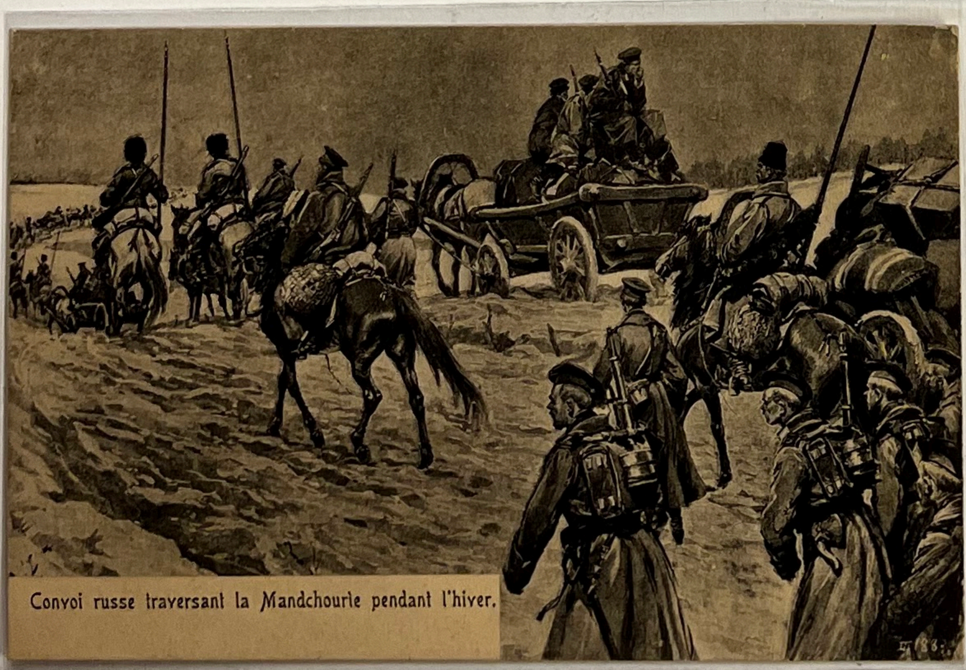
Convoi russe traversant la Mandchourie pendant l'hiver.