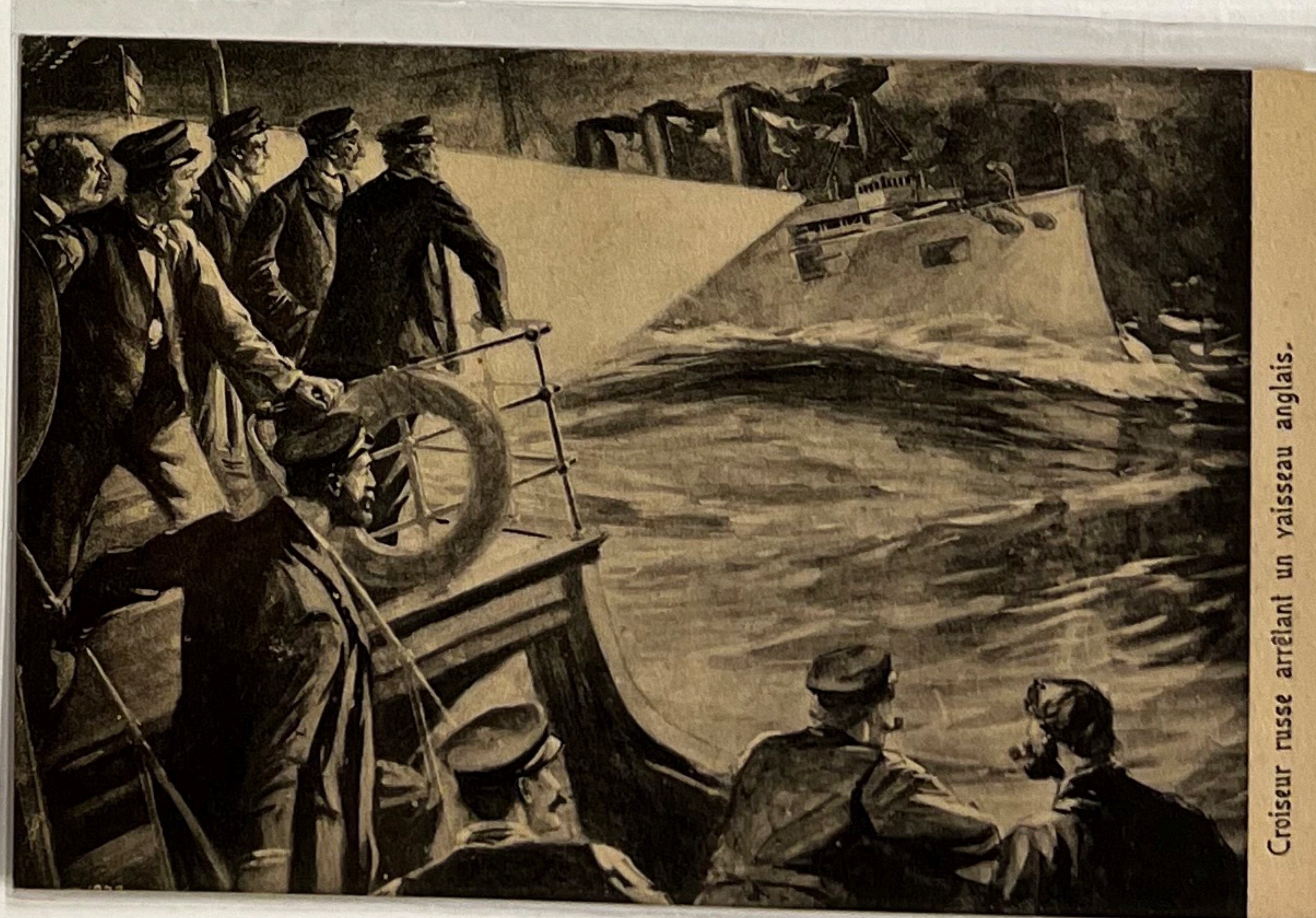
Croiseur russe arrêtant un vaisseau anglais.