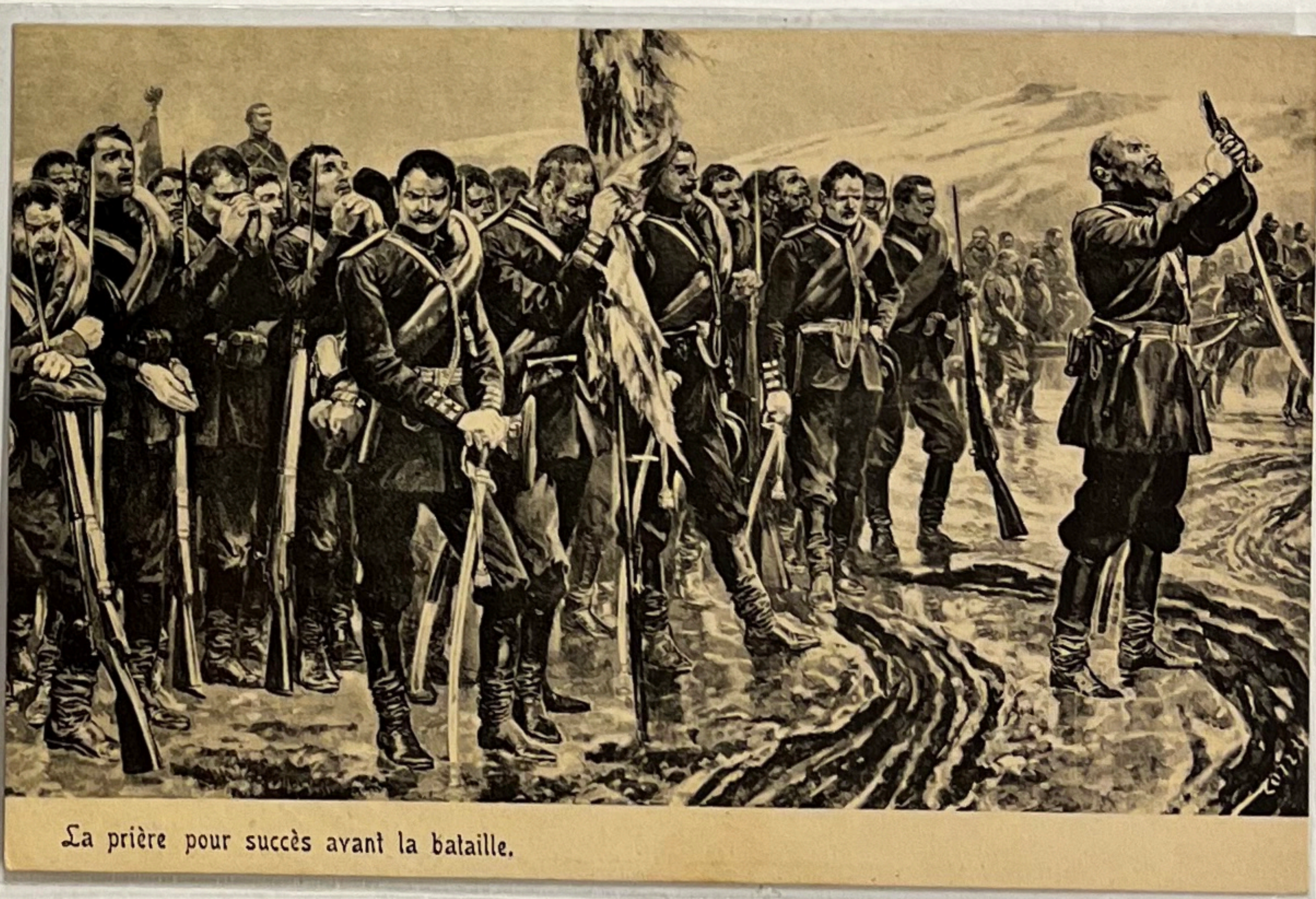
La prière pour succès avant la bataille.