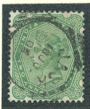
1892: Mi 43 ex Brettl