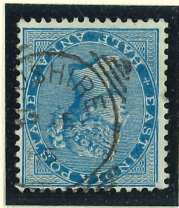
"squared circle" auf East India Co.-Marken