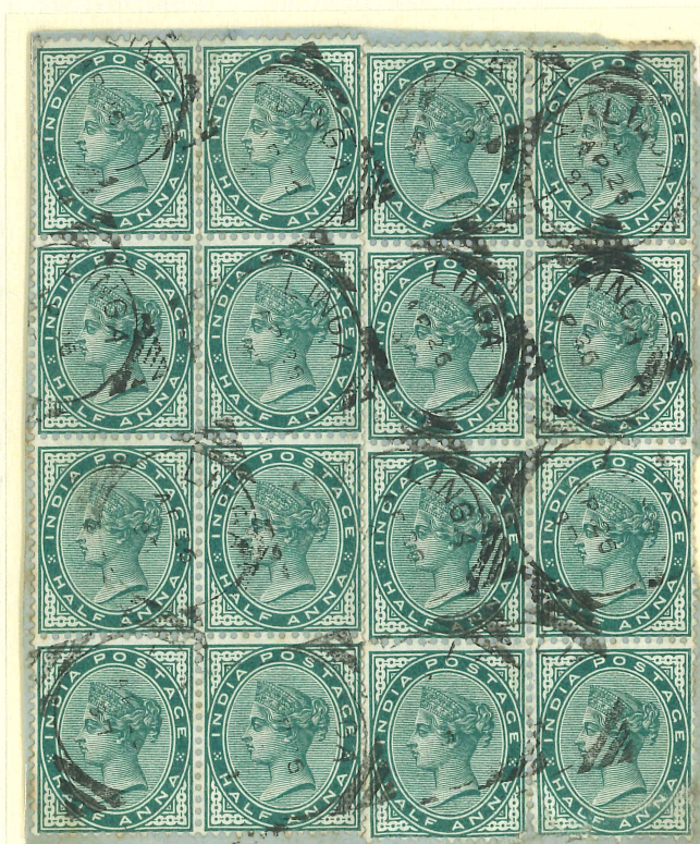
Zwei 8er-Einheiten ½ Anna Mi 31 mit "squared circle" "LINGA / AP. 26 / 97" als 8 As-Porto auf verstärktem Umschlag