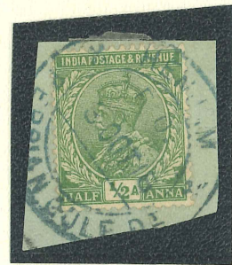
HENJAM, ex Heath (Singh) Mi-Nr. 76