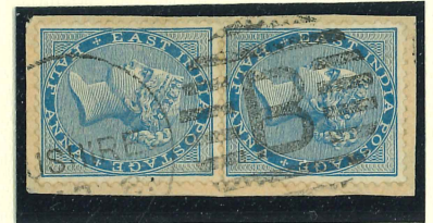
Type 34/35 Bombay Circle

1878/80: Zwei Briefe von Bushire nach Bombay mit gewichtsabhängigem Porto, verschiedene englische Schreibweisen der Stadt im Poststempel