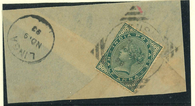
Nov. 1893 Bushire nach Linga