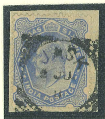
1903: Mi 59 ex Singh