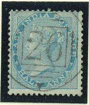
"26" in Type 9