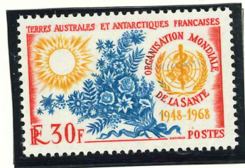
1968. — 20 e anniversaire de l'Organisation Mondiale de la Santé. Dent. 13.