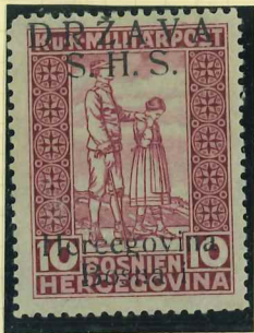
A20I wading signed transposed