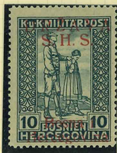
19I proof signed Certificate