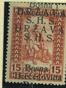
20I DD Certificate