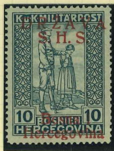
19I proof signed