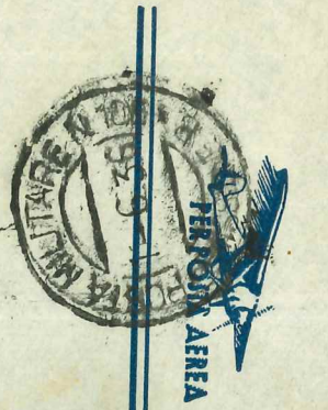
Figura Clementina Berra Via a Fretti 7 PISA (Italia)