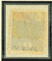
RARE 1 Kram