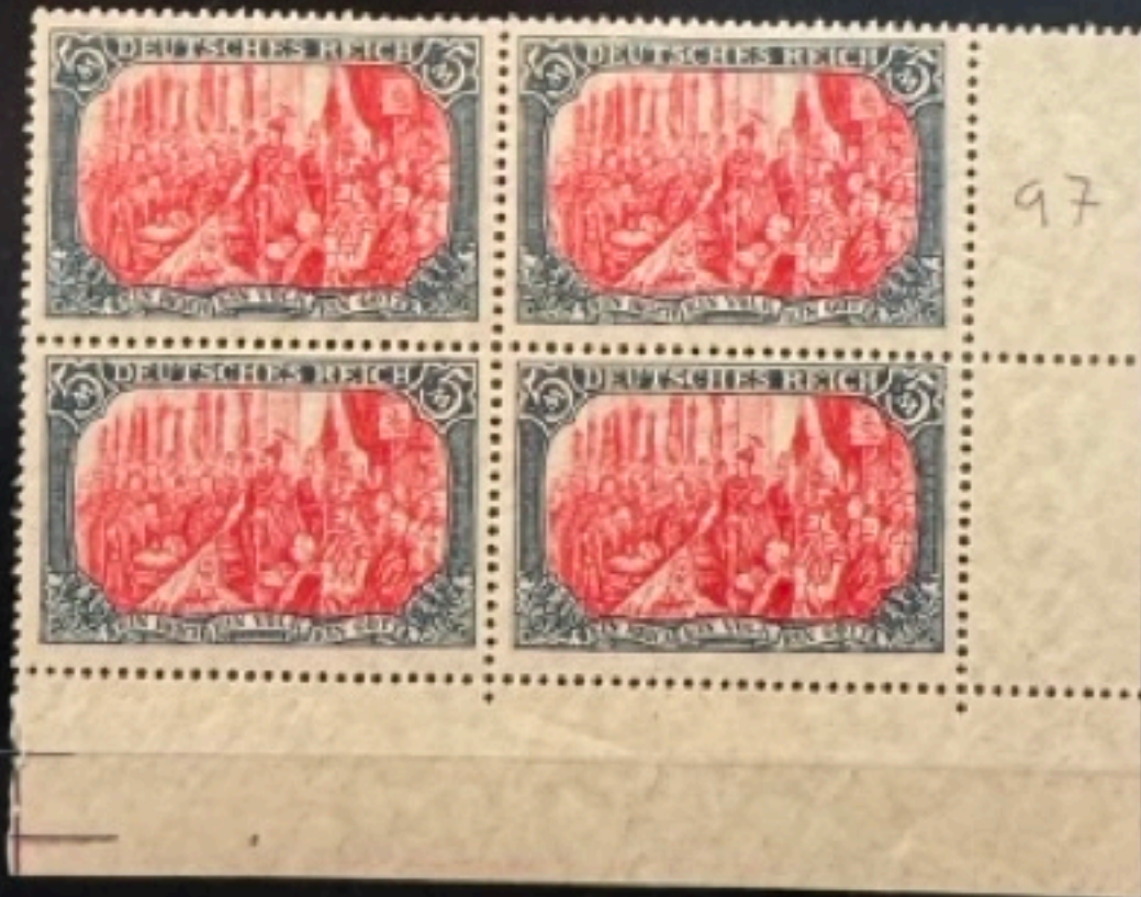
L'Empereur Guillaume II à Berlin Emission 1902/20, gomme blanche