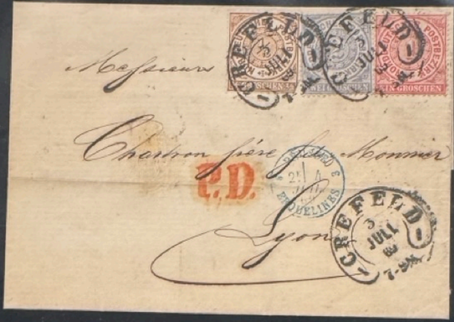
LETTRE CREFELD - LYON 1869 Expédiée de la Confédération de l'Allemagne du Nord, de Crefeld, le 3.7.1869, 7-8 h du soir (7-8 N), elle traverse un camp militaire de Napoléon III en Prusse avant qu'éclate la guerre franco-allemande de 1870-71. La lettre parvient à l'entreprise Chartron Frères Fils Monnier à Lyon le 5.7.1869, ayant passé par Lyon, Les Terreaux, auparavant. L'affranchissement est de 3 1/2 Groschen pour la France et le port n'a pas été payé (P.D.). Cachets : Crefeld en fer à cheval; Bleu 1 cercle France, 4ème régiment; double cercle Lyon.