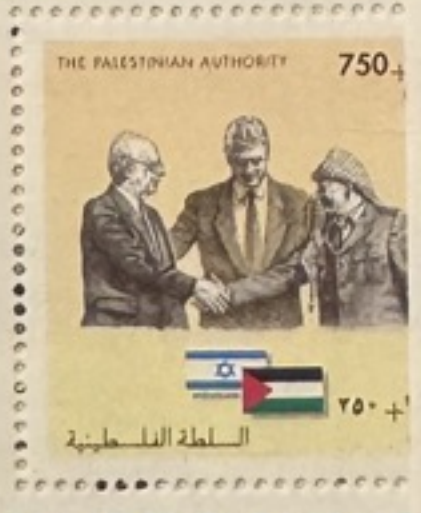
غزة وأريحا للسلام