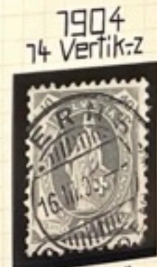
1904 74 Vertik-z