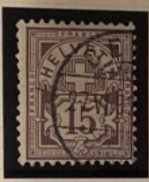
64 Ba 1