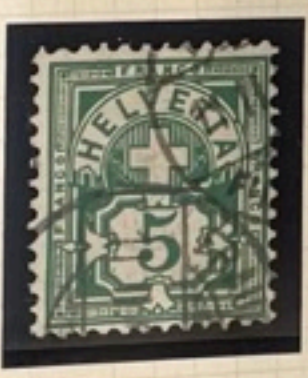
65 B I