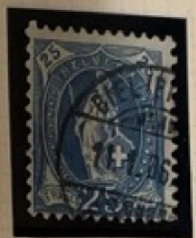
Type I 87 a