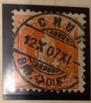
86 RR nach post. M.