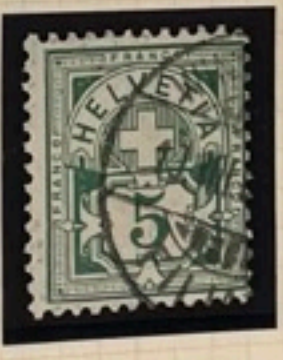
65 B II