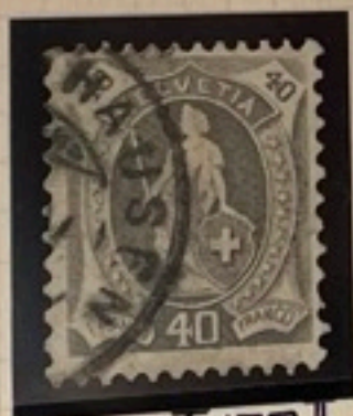
Type I 89 a