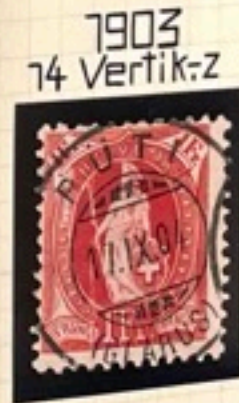
1903 74 Vertik-z