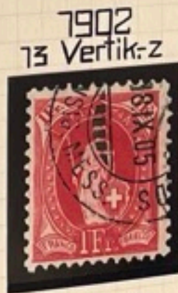
1902 73 Vertik-z