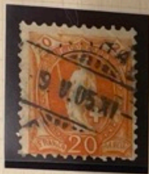
7. Stern r. farbl. 66E