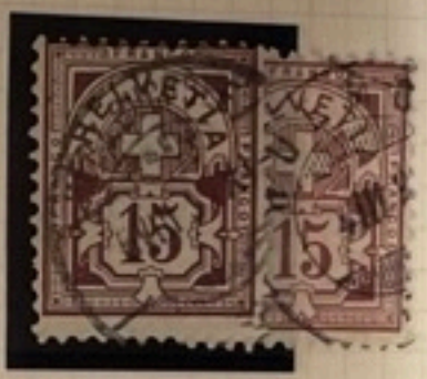
64 Bb II