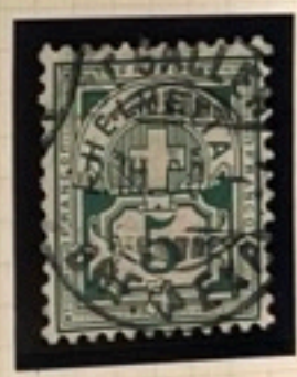
65 Bd III