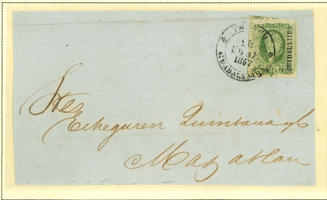
Small Plate Crack