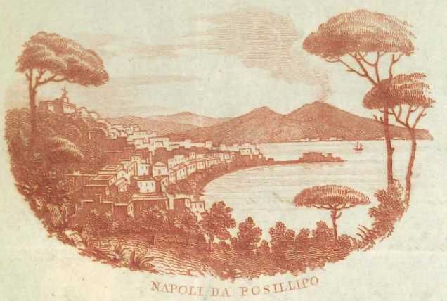
NAPOLI DA POSILLIPO