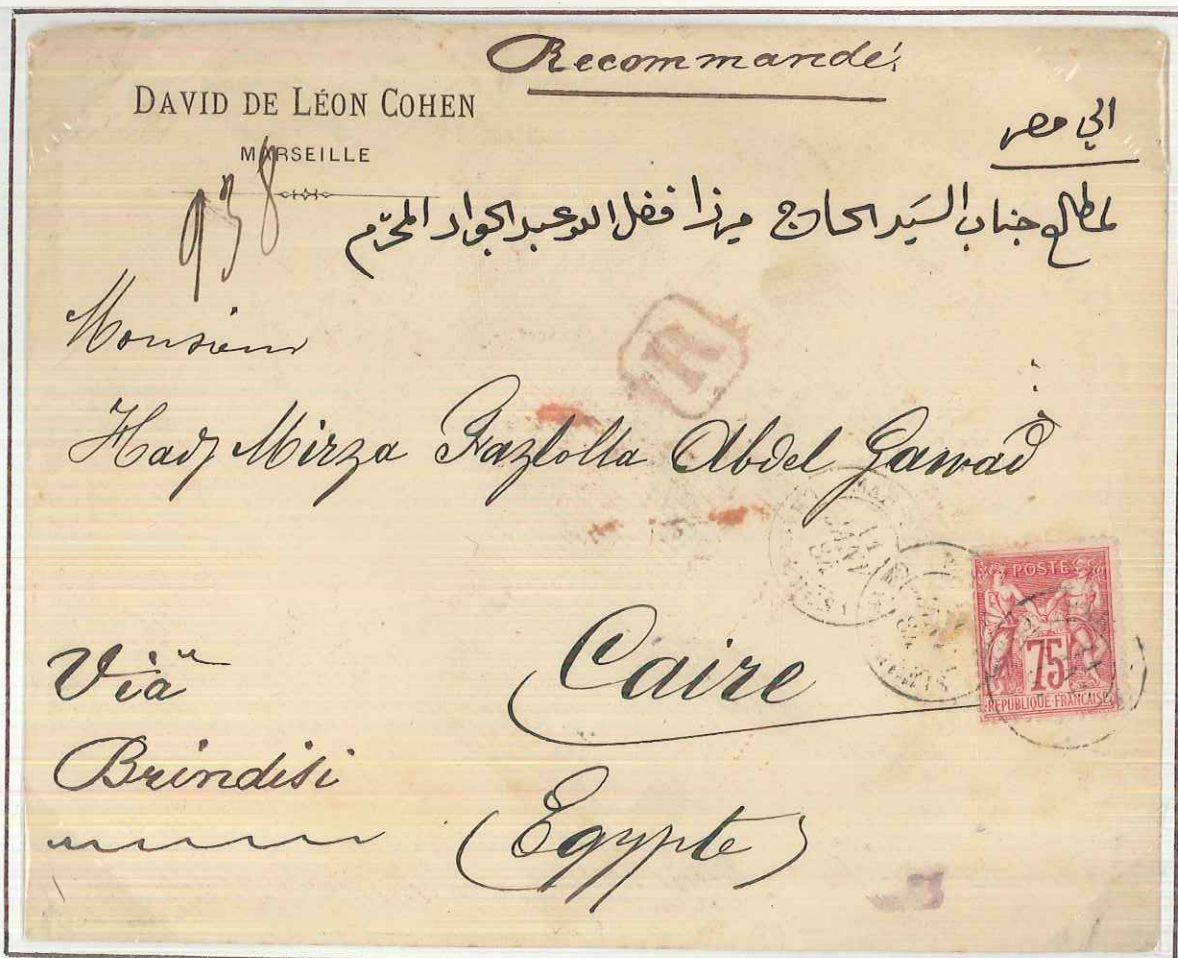
Lettre recommandée de Marseille pour Le Caire (Egypte) Tarif du 01.04.1879, décret du 16.04.1879, 2 ème échelon de poids 15 à 30g. = 50c. + taxe de recommandé de 25c. tarif du 16.01.1879, loi du 26.12.1878. Voie de Brindisi.