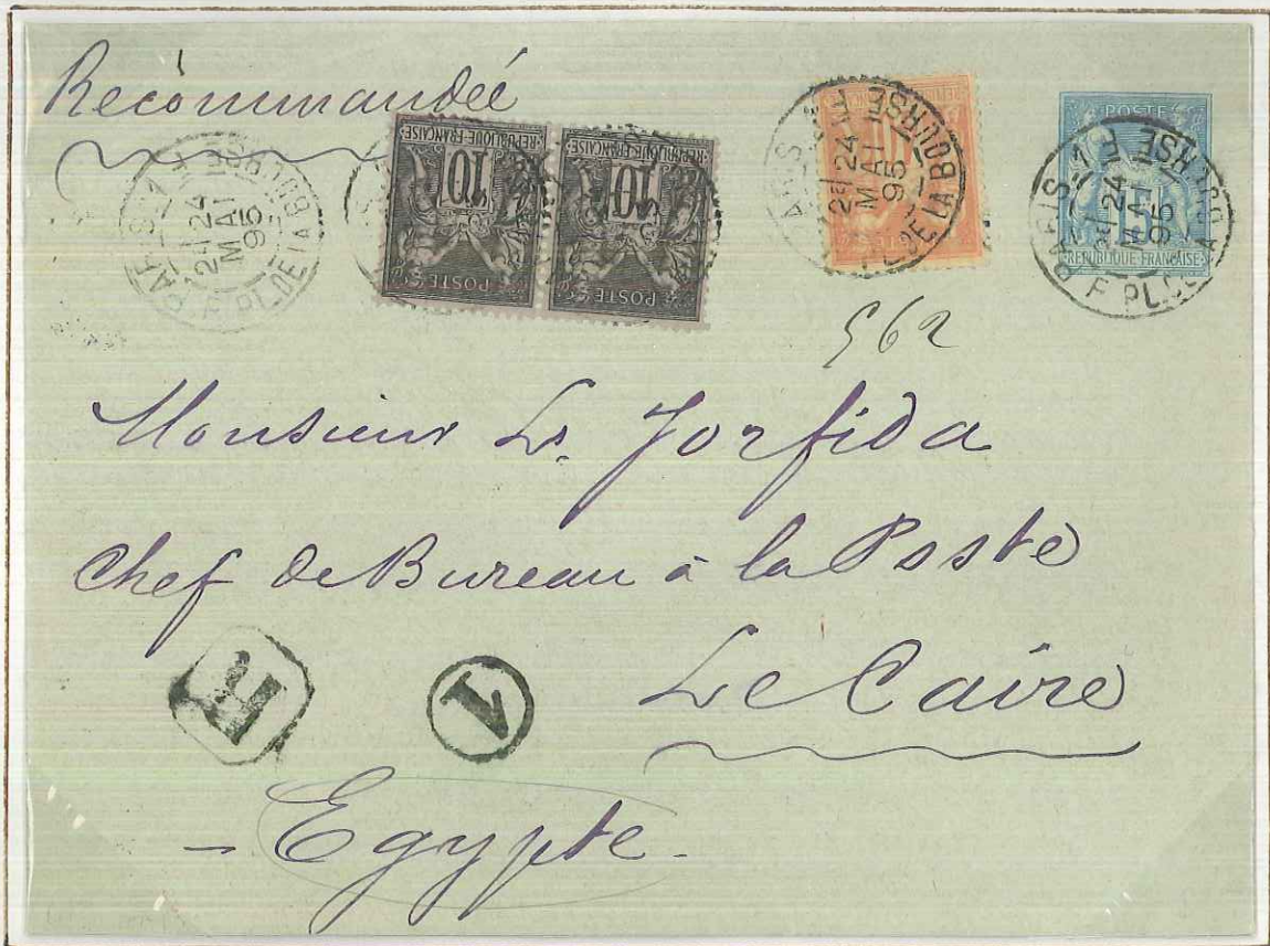
Tarif du 01.05.1878 : Décret du 16.04.1878, 2 ème échelon de poids, 15 à 30g. = 50 c. + taxe de recommandé de 25 c. tarif du 16.01.1879 : Loi du 26.12.1878 – Timbre à date type A.