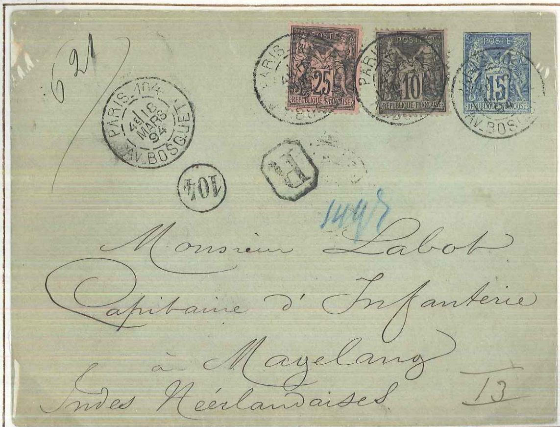
1 er échelon de poids 0 à 15 g = 25 c. + taxe de recommandé de 25c., Tarif du 26.01.1879, loi du 26.12.1878 et décret du 3.01.1879.