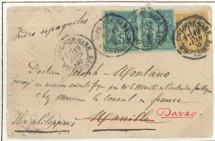
Lettre de Toulouse du 19 juin 1880 pour Manille et réexpédiée à Davao, île de Mandanao. Tarif du 1.04.1879 dit "tarif n°2 des Etats-Unis", 1 er échelon de poids 0 à 15g. = 35c.

En 1585 les Philippines passent sous la suzeraineté espagnole, Manille devient la capitale. Une insurrection éclate en 1896. En 1898, les Etats-Unis entrent en guerre avec l'Espagne et se font céder les Philippines.