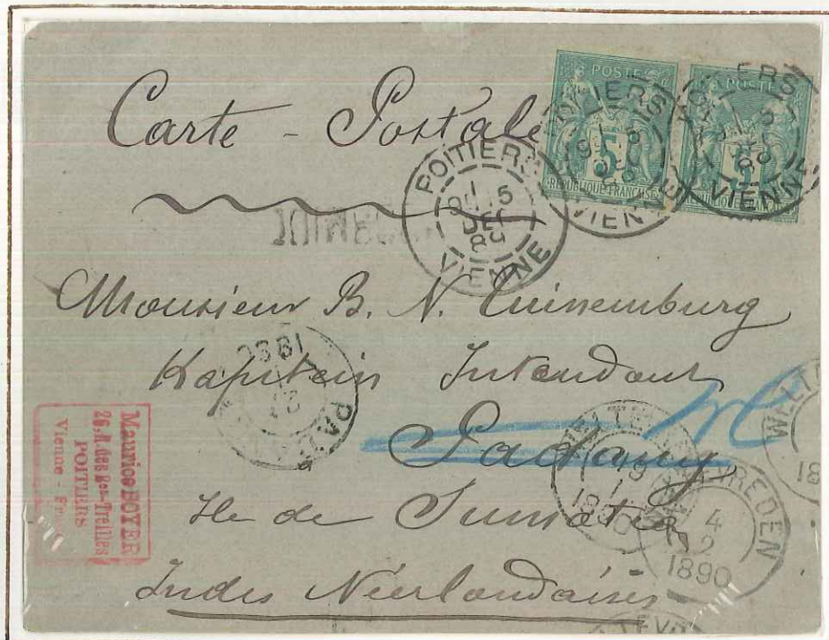
Carte postale (mention manuscrite) de Poitiers ( Vienne ) pour Padang = 10 c

Tarif unique U.P.U. du 1.10.1881 : décret du 7.09.1881, abandon de toutes les surtaxes maritimes