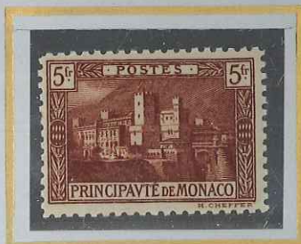
5 F BRUN-ROUGE