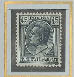
45 c GRIS-NOIR