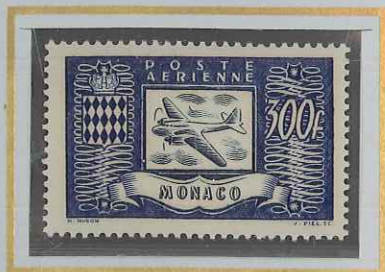
300 F OUTREMER & BLEU