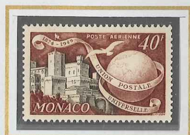
40 F BRUN & SÉPIA