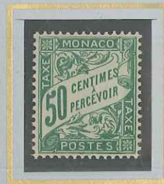
50 c VERT