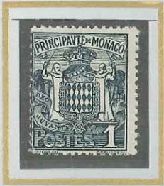
1 c GRIS-NOIR