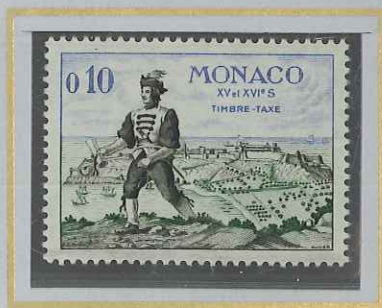
0,10 HOMME D'ARMES