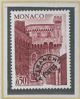
0,50 LIE DE VIN