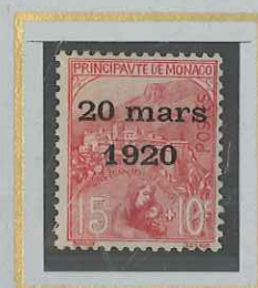
15c + 10c