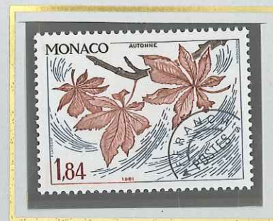
1 F 84 AUTOMNE