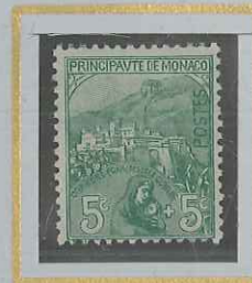
5 c + 5 c VERT