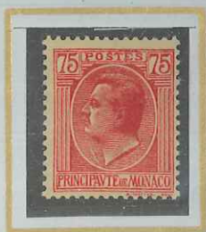
75 c ROSE s. PAILLE