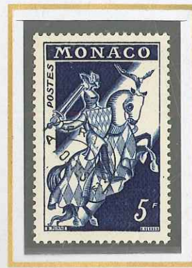
5 F BLEU - NOIR