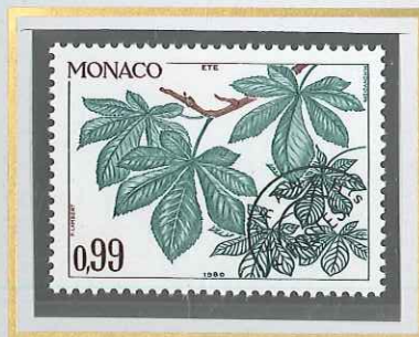
0,99 VERT - BLEU ET BRUN