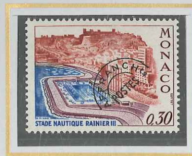
0,30 BRUN, BLEU, LILAS