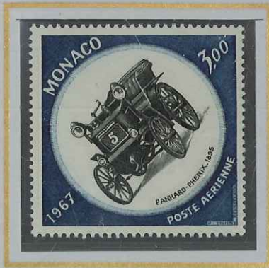
3 F PANHARD-PHENIX