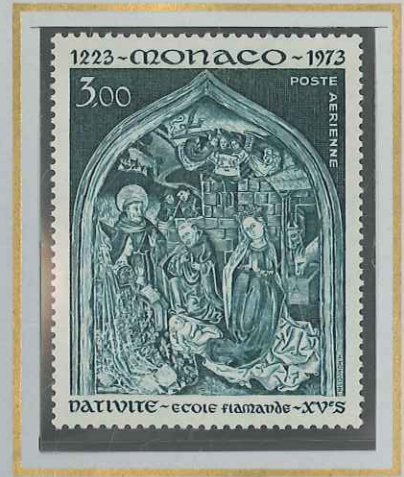
3 F NATIVITÉ