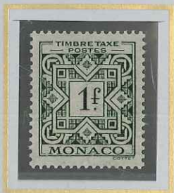
1 F VERT