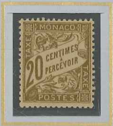
20 c BISTRE