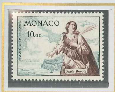
10 F BRUN & VERT-BLEU