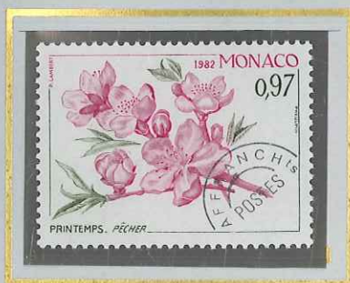
0 F 97 PRINTEMPS