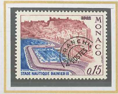
0,15 GRIS, BLEU, LILAS