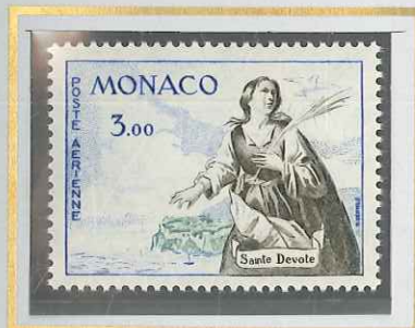
3 F OUTREMER,GRIS-OLIVE & VERT