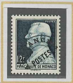
12 F VERT-NOIR