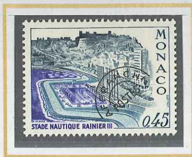
0,45 ARDOISE, VIOLET ET VERT