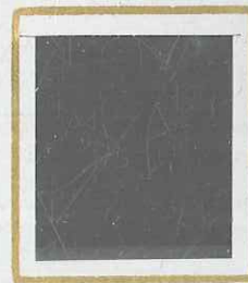
5 F CARMIN s. VERT