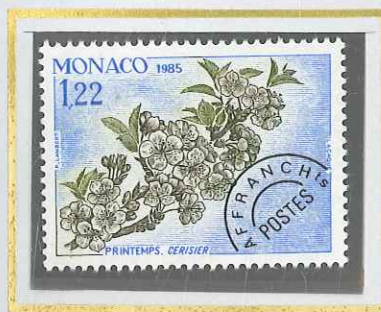
1 F 22 PRINTEMPS