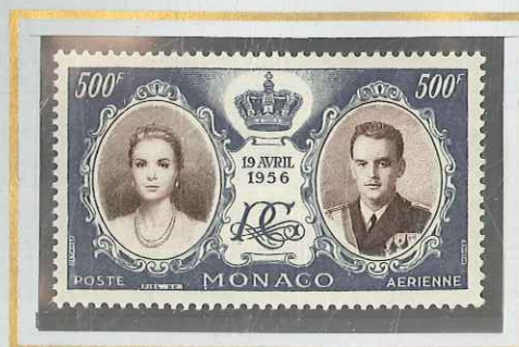
MARIAGE PRINCIER 500 F GRIS & SÉPIA