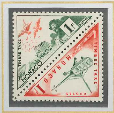
1 F VERT ET ROUGE PIGEONS - HÉLIPTÈRE