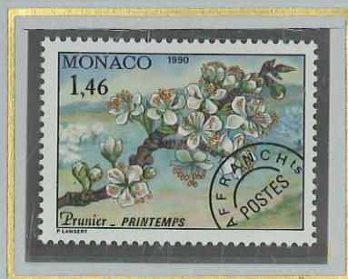
1 F 46 PRINTEMPS