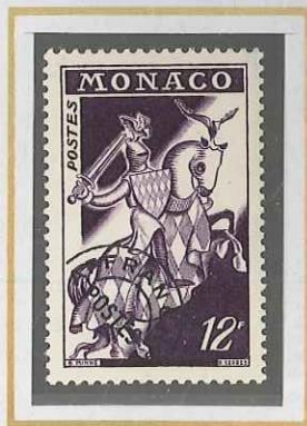
12 F VIOLET FONCÉ