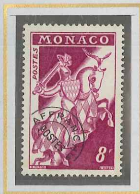
8 F LILAS-ROSE