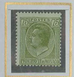
75 c OLIVE s. VERDATRE