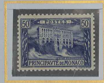
50 c BLEU