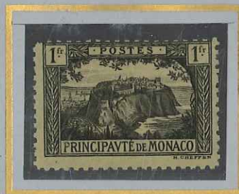
1 F NOIR s. JAUNE