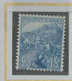
25 c + 15 c BLEU