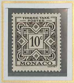
10 c BRUN-NOIR