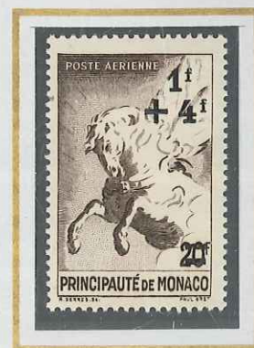
1 F + 4 F s. 20 F SÈRIA