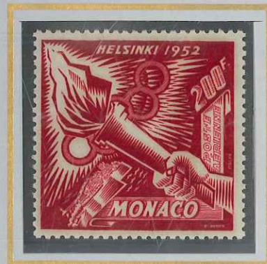
200 F CARMIN