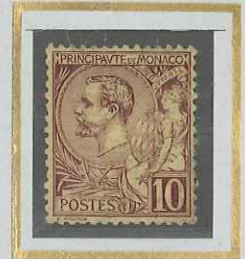
10 c BRUN s. JAUNE