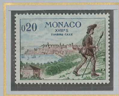
0,20 COURRIER A PIED