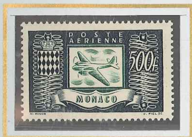
500 F VERT-NOIR & VERT