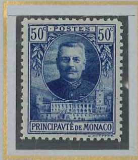
50 c BLEU