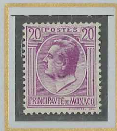
20 c LILAS