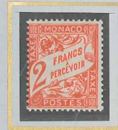
2 F VERMILLON