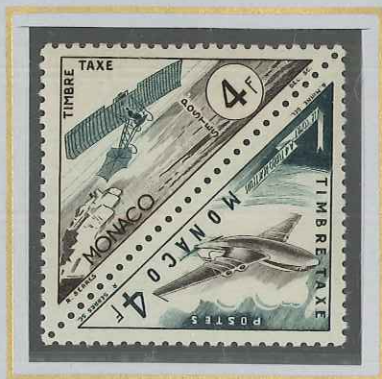
4 F BISTRE ET OLIVE AVIONS