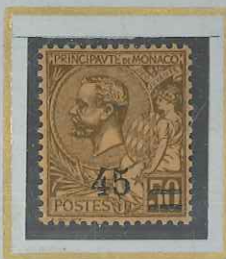
45 c s. 50 c