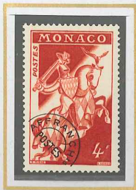
4 F ROUGE BRUN