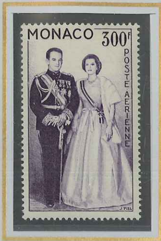
300 F VIOLET FONCÉ