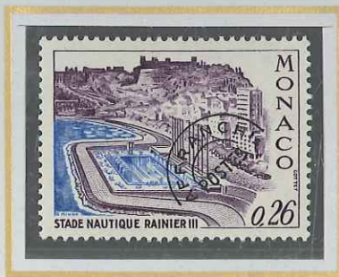
0,26 VIOLET ET OUTREMER