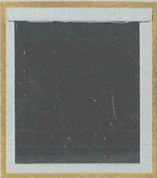
15 c ROSE