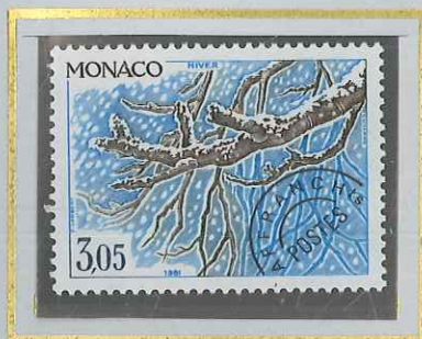
3 F 05 HIVER