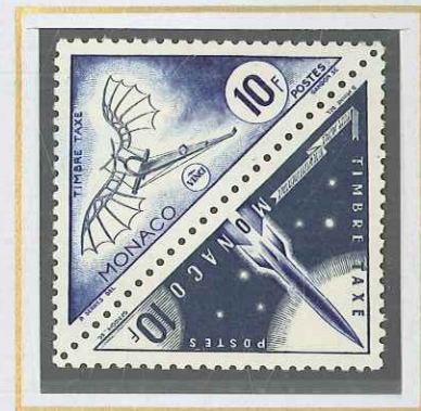
10 F OUTREMER ET GRIS ÉOLE - FUSÉE