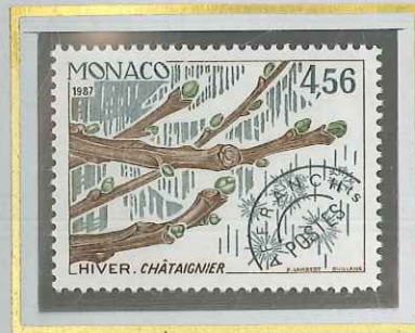
4 F 56 HIVER