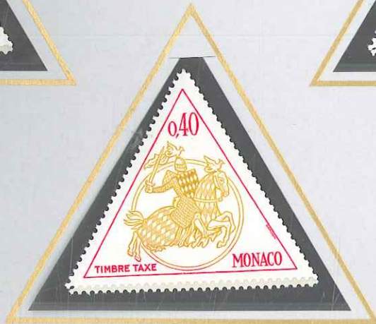
0,40 JAUNE, OLIVE ET ROUGE