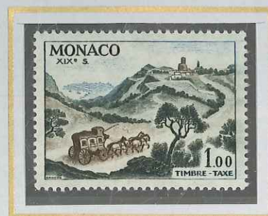
1,00 DILIGENCE A LA TURBIE