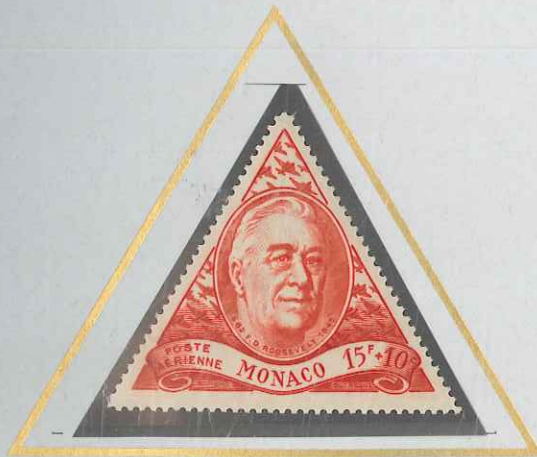
15 F + 10 F FROUGE-ORANGÉ