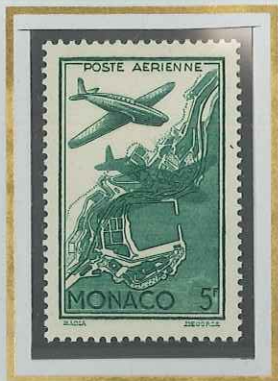
5 F VERT