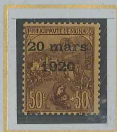
50c + 50c