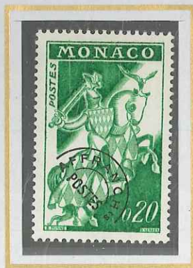
0,20 VERT VIF