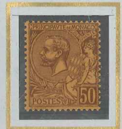
50 c LILAS-BRUN s. OR