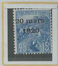
25c + 15c