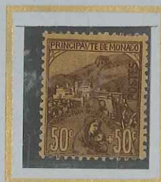
50 c + 50 c LILAS-BRUN s. ORANGE