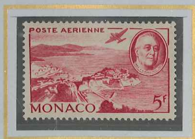
5 F ROSE-CARMINÉ