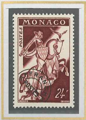
24 F BRUN - LILAS