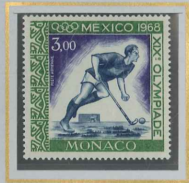
3 F MEXICO-HOCKEY