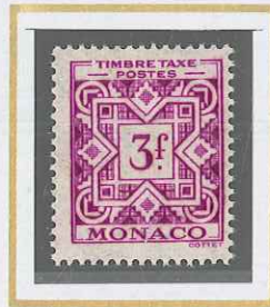
3 F LILAS-ROSE