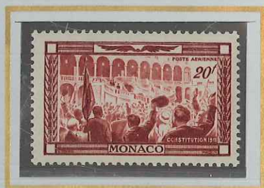
20 F CARMIN