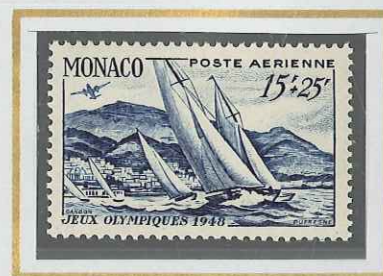
15 F + 25 F BLEU