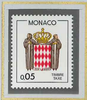
0 F 05 ROUGE BRUN