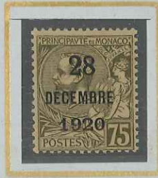
75 c BRUN-OLIVE s. CHAMOIS