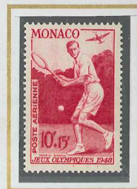
10 F + 15 F CARMIN