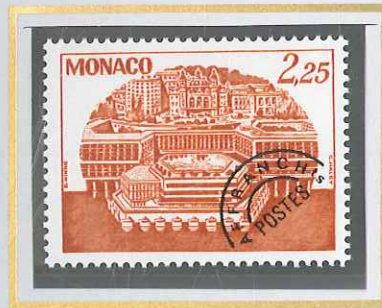
2,25 BRUN - ORANGE