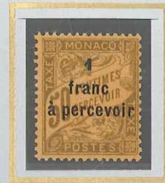
1 F S. 50 c BISTRE S. ORANGE