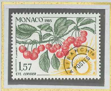
1 F 57 ÉTÉ