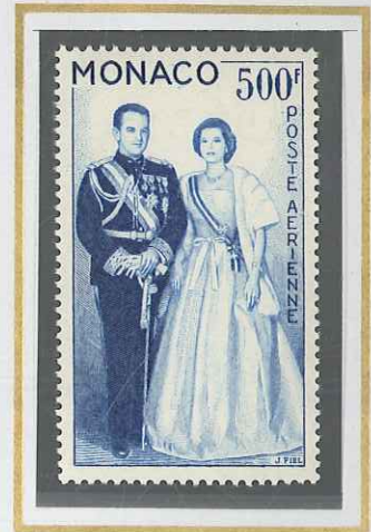
500 F BLEU CIEL