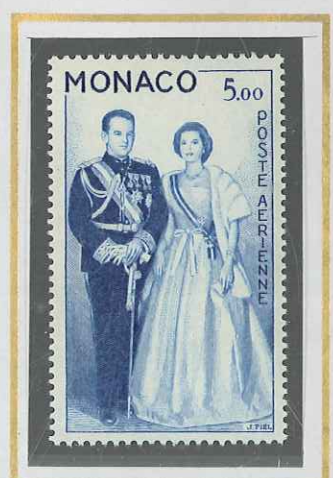
5 F BLEU