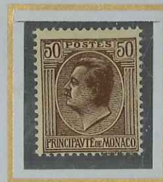
50 c BRUN-LILAS s. JAUNE