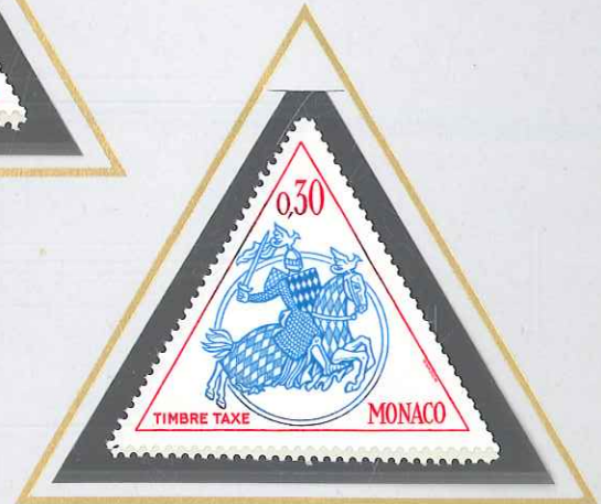
0,30 BLEU ET ROUGE