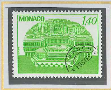
1,40 VERT - JAUNE