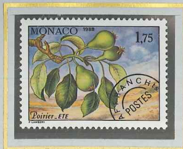
1 F 75 ÉTÉ