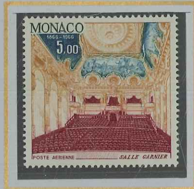
5 F THÉÂTRE DE MONTE-CARLO