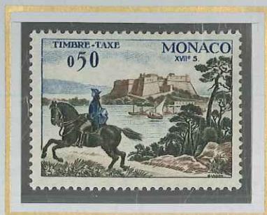
0,50 COURRIER A CHEVAL