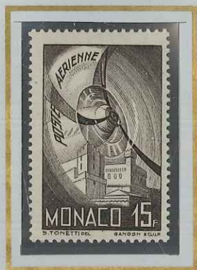
15 F BRUN-NOIR