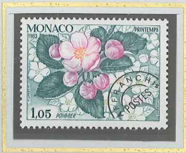
1 F 05 PRINTEMPS