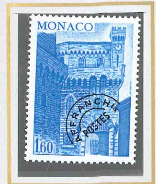
1,60 BLEU VIF