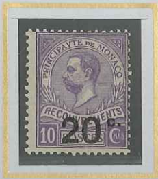
20 c S. 10 c VIOLET