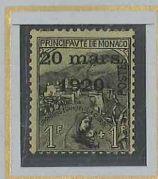
1F + 1F