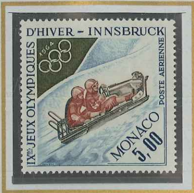
5 F JEUX D'HIVER INNSBRUCK