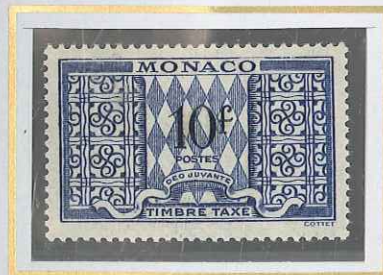
10 F BLEU