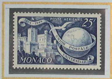
25 F BLEU