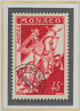
45 F ROUGE