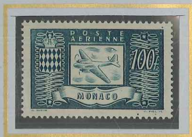
100 F VERT-BLEU