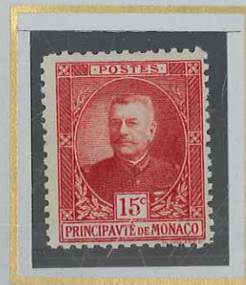
15 c CARMIN