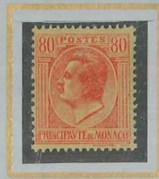
80 c ROUGE s. JAUNE