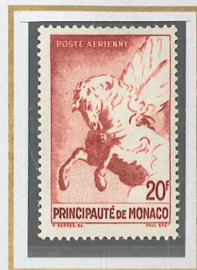
20 F CARMIN-BRUN