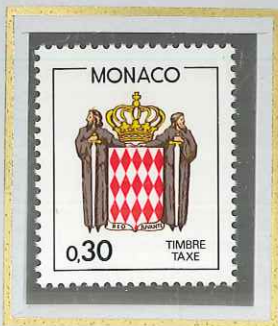
0 F 30 ROUGE BRUN