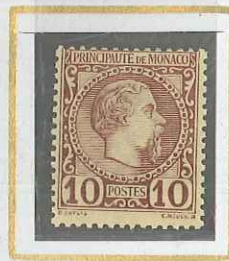
10 c BRUN s. JAUNE