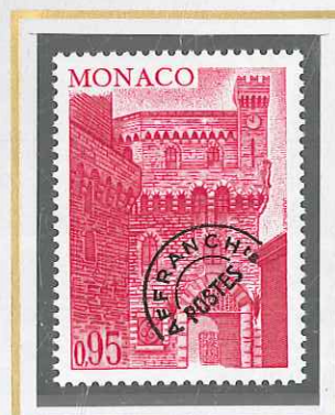
0,95 ROUGE - CARMINÉ