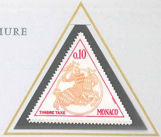
0,10 BISTRE, ORANGE ET ROSE