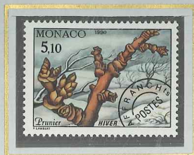
5 F 10 HIVER