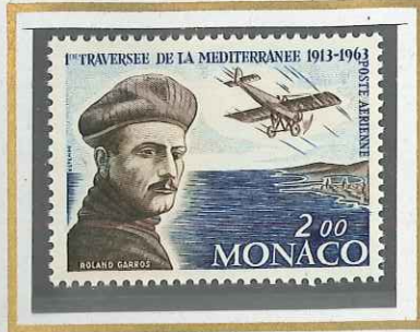
2 F ROLLAND GARROS 1965