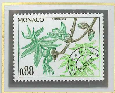
0 F 88 PRINTEMPS