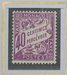
40 c VIOLET