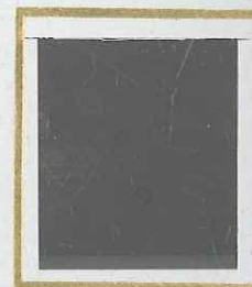
75 c NOIR s. ROSE