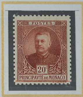
20 c BRUN