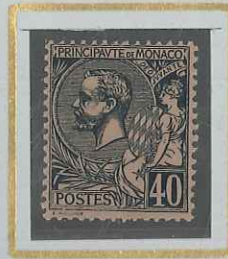
40 c BLEU s. ROSE