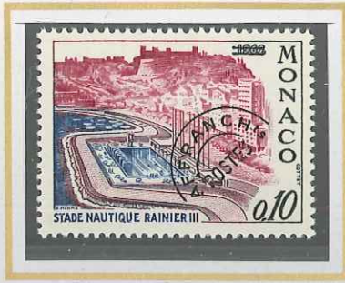
0,10 NOIR, ROSE, BLEU, VIOLET