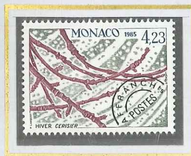
4 F 23 HIVER