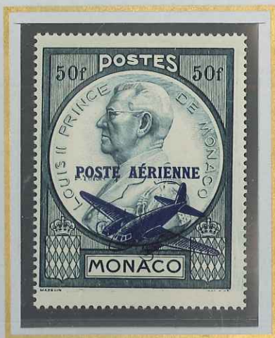
50 F VERT