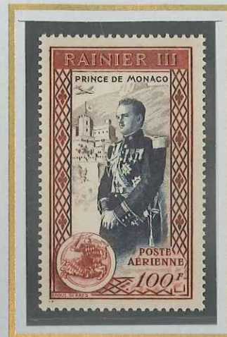
PRINCE RAINIER III 100 F BRUN & BLEU FONCÉ