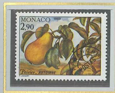
2 F 90 AUTOMNE