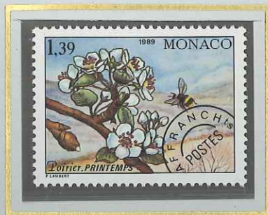
1 F 39 PRINTEMPS