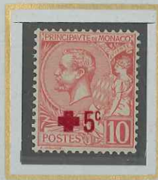
+ 5 c. 10 c ROSE