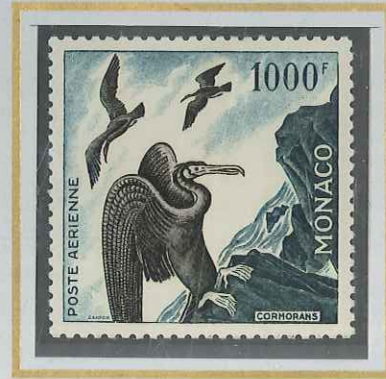
1000 F VERT & SÉPIA