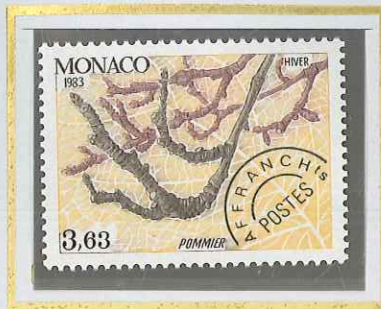
3 F 63 HIVER