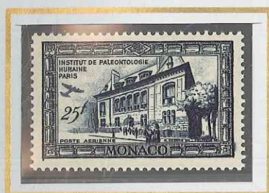
25 F ARDOISE