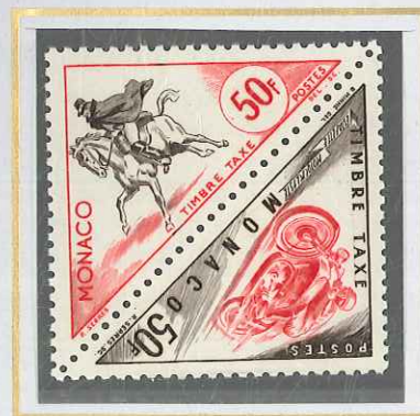
50 F BISTRE ET ROSE MOTOCYCLETTES