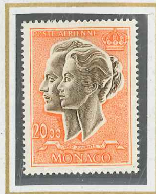
20 F ORANGE