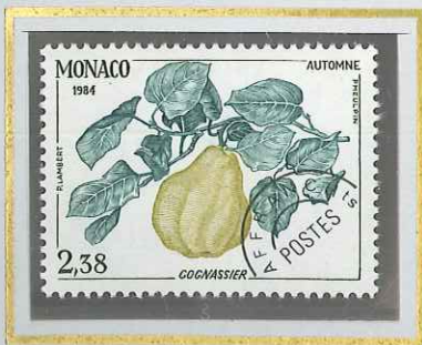
2 F 38 AUTOMNE