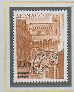
2 F S. 1,85 BRUN CLAIR