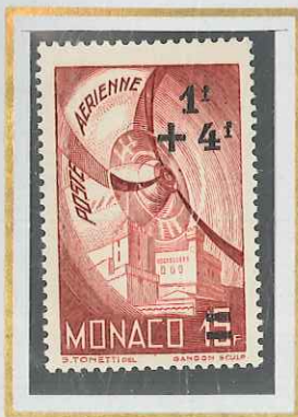
1 F + 4 F s. 15 F BRUN-ROUGE