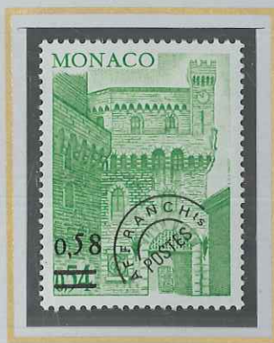
0,58 S. 0,54 VERT - JAUNE