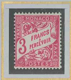
3 F ROSE-LILAS