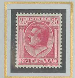
25 c ROSE