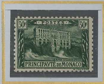
30 c VERT FONCE