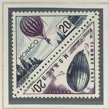
20 F OUTREMER ET VIOLET BALLON - ZEPPELIN