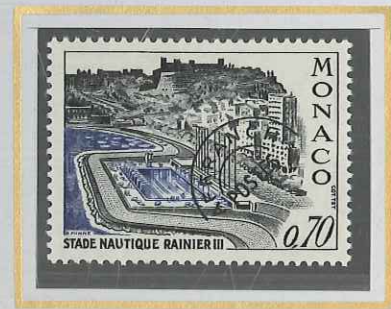
0,70 NOIR ET OUTREMER