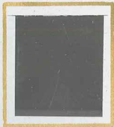
1 c VERT-OLIVE