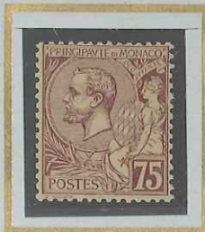
75 c VIOLET-BRUN s. PAILLE