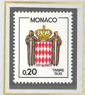
0 F 20 ROUGE BRUN