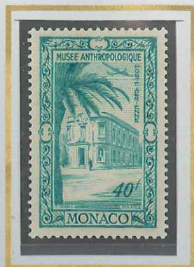
40 F VERT