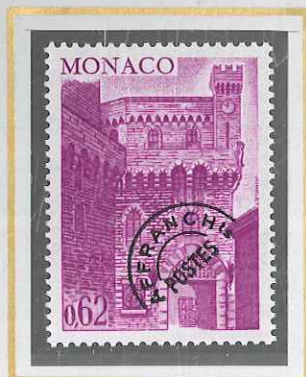
0,62 LILAS - ROSE