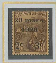
2c + 3c s. 50c + 50c