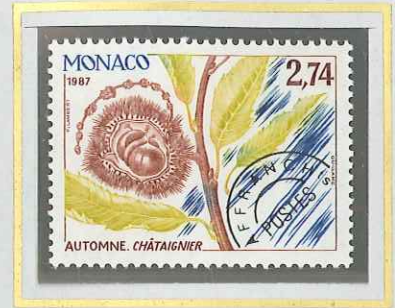
2 F 74 AUTOMNE