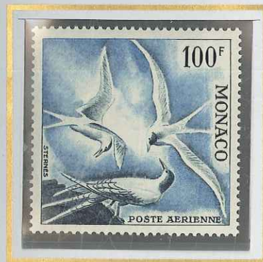
100 F ARDOISE & OUTREMER