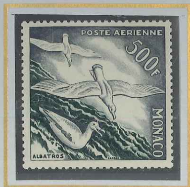
500 F GRIS & VERT-NOIR