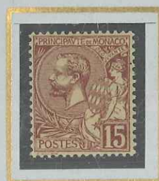
15 c BRUN-LILAS s. JAUNE