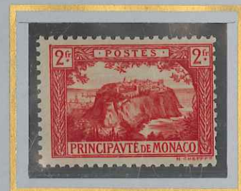
2 F VERMILLON VIF