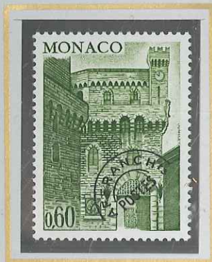
0,60 VERT - OLIVE