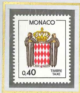
0 F 40 ROUGE BRUN