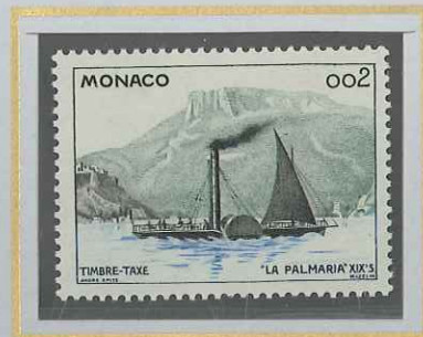
0,02 BATEAU PALMARIA