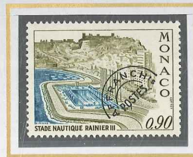
0,90 OLIVE ET TURQUOISE