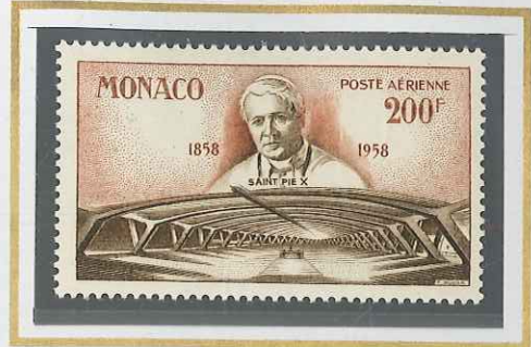
200 F BRUN-ROUGE & BRUN