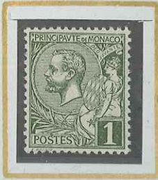
1 c OLIVE