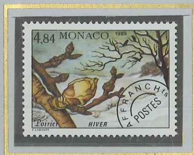
4 F 84 HIVER