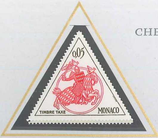
0,05 ROUGE ET OLIVE