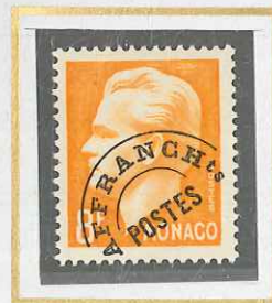
8 F JAUNE OR