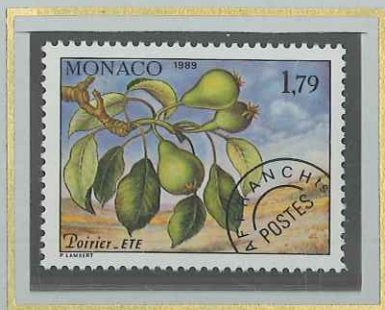
1 F 79 ÉTÉ