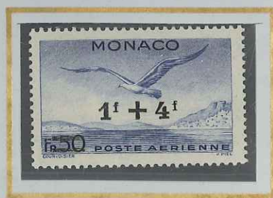
1 F + 4 F s. 50 F BLEU