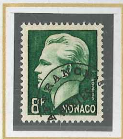
8 F VERT FONCÉ