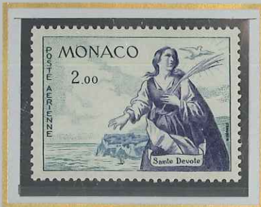
2 F VIOLET & BLEU CLAIR