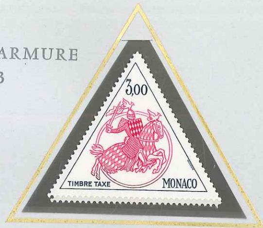
3 F NOIR - ROUGE