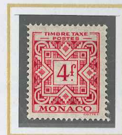
4 F ROSE-CARMINÉ