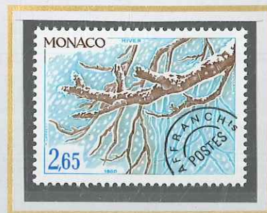
2,65 TURQUOISE ET BRUN