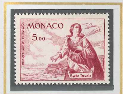
5 F LIE DE VIN