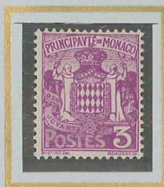
3 c LILAS