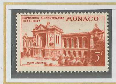
3 F ROUGE-BRUN