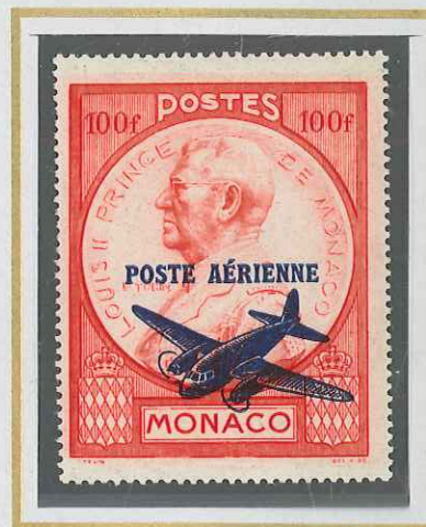
100 F ROUGE