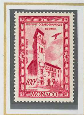
100 F GROSEILLE