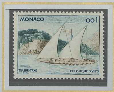
0,01 FELOUQUE PRINCIÈRE