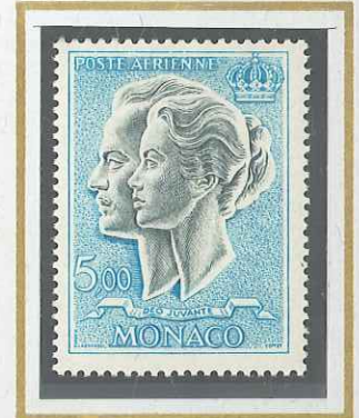
5 F TURQUOISE