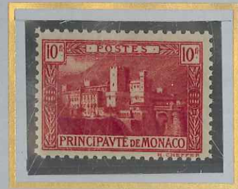
10 F CARMIN