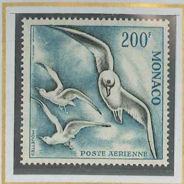
200 F BLEU & GRIS-NOIR