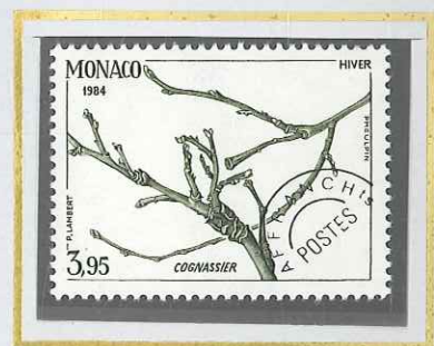
3 F 95 HIVER