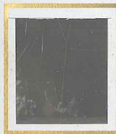
40 c BLEU s. ROSE