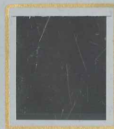
5F + 5F