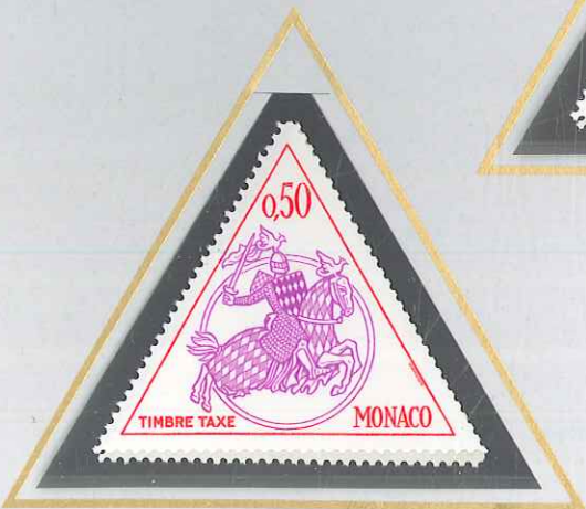
0,50 LILAS ET ROUGE