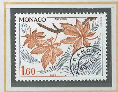
1,60 GRIS, BRUN ET SÉPIA