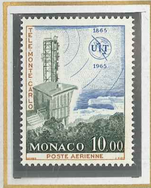
10 F U.I.T