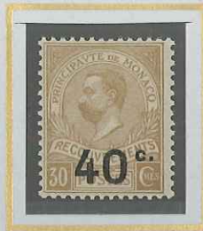
40 c S. 30 c BISTRE