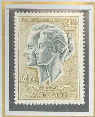
10 F OCRE