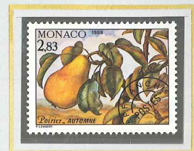
2 F 83 AUTOMNE