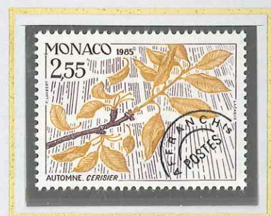
2 F 55 AUTOMNE