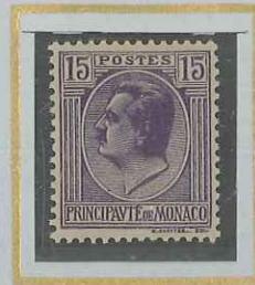
15 c VIOLET-GRIS