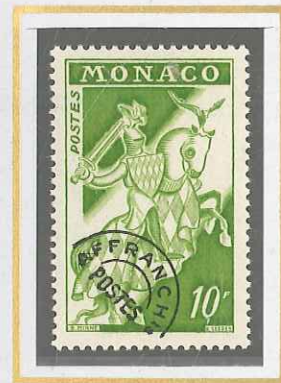
10 F VERT-JAUNE