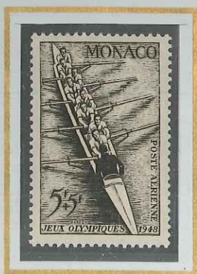
5 F + 5 F SÉPIA