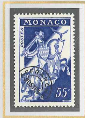
55 F OUTREMER