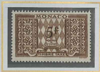
5 F SÈPIA