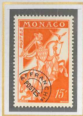
15 F ORANGE