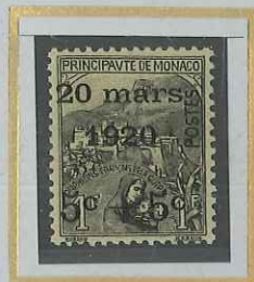
5c + 5c s. 1F + 1F