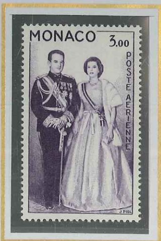
3 F VIOLET FONCÉ