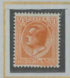
30 c ORANGE