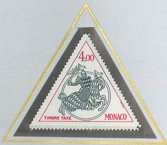
4 F ROUGE - VERT