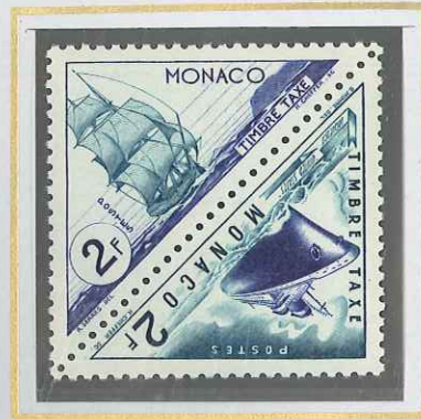
2 F OUTREMER ET TURQUOISE VOILIER ET PAQUEBOT