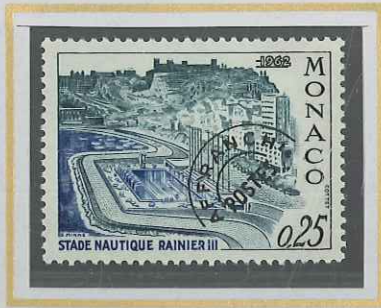
0,25 NOIR, VERT, BLEU