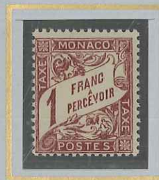
1 F LILAS-BRUN