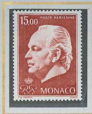
15 F ROUGE-BRUN