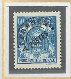
60 c BLEU-VERT