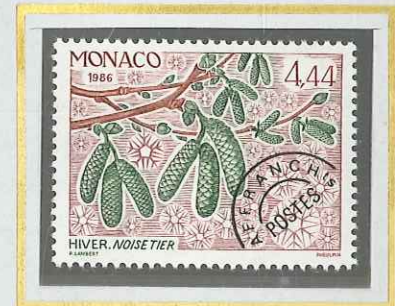
4 F 44 HIVER