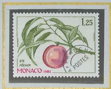
1 F 25 ÉTÉ