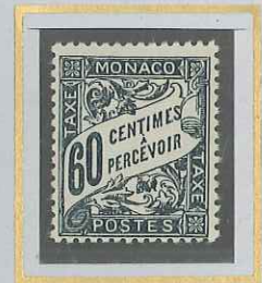
60 c GRIS-NOIR