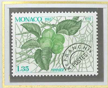
1 F 35 ÉTÉ