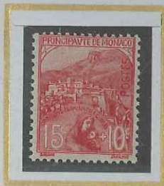
15 c + 10 c ROSE