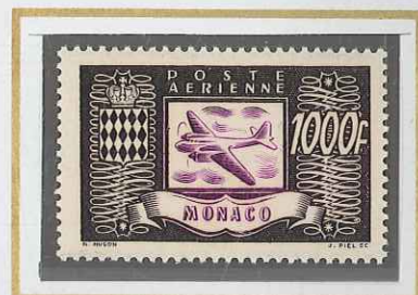
1000 F SÉPIA & LILAS