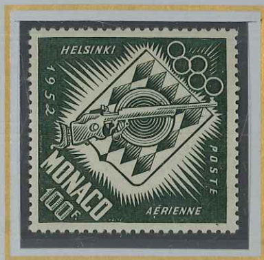
100 F VERT