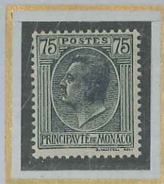
75 c GRIS-NOIR