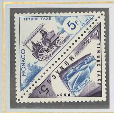
5 F BLEU CLAIR ET MAUVE VOITURES