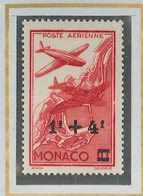
1 F + 4 F s. 10 F CARMIN