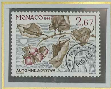
2 F 67 AUTOMNE