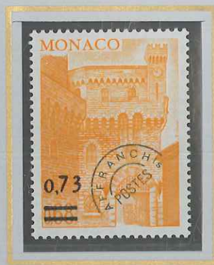
0,73 S. 0,68 ORANGE