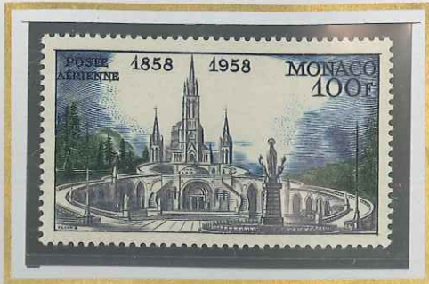
100 F BLEU,VERT & GRIS