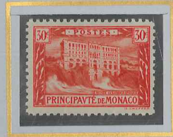
30 c VERMILLON