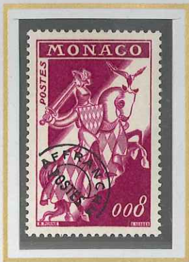
0,08 LILAS - ROSE