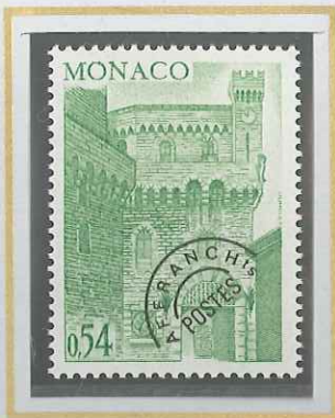
0,54 VERT - JAUNE