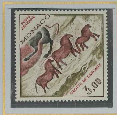
3 F GROTTE DE LASCAUX