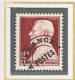
15 F CARMIN FONCÉ