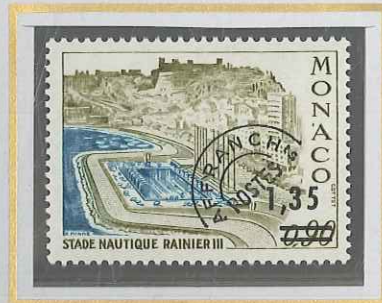
1,35 S. 0,90 OLIVE ET TURQUOISE