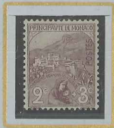
2 c + 3 c VIOLET-BRUN