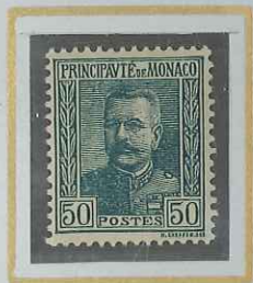
50 c VERT-GRIS