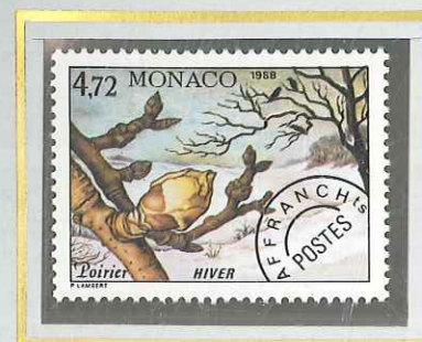
4 F 72 HIVER