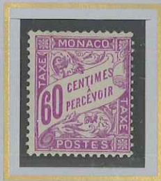
60 c LILAS