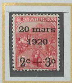
2c + 3c s. 75c + 10c