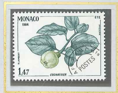
1 F 47 ÉTÉ