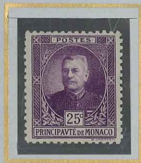
25 c VIOLET