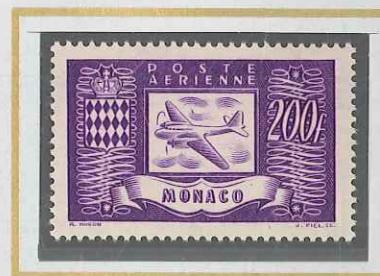
200 F LILAS