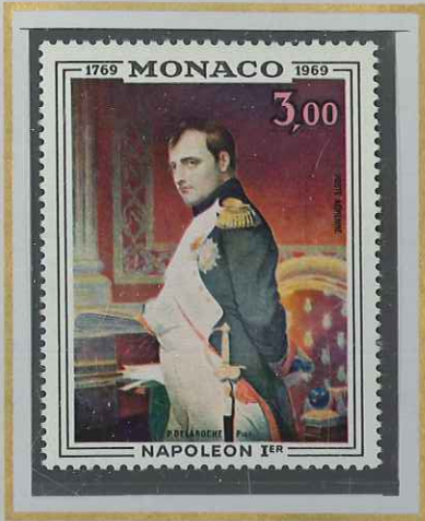
3 F NAPOLÉON I