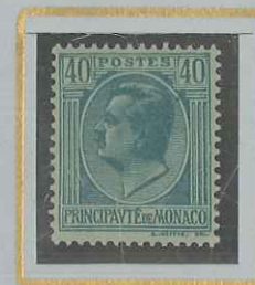
40 c BLEU s. AZURÉ