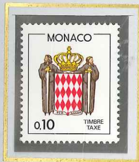
0 F 10 ROUGE BRUN