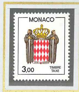
3 F ROUGE BRUN