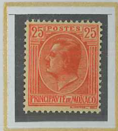
25 c ROUGE s. JAUNE