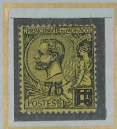
75 c s. 1 F