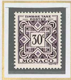
30 c VIOLET