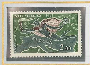
2 F VERT,BRUN & ARDOISE