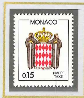
0 F 15 ROUGE BRUN