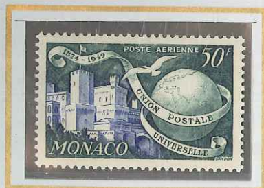
50 F VERT & OUTREMER