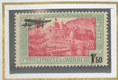
1 F 50 SUR 5 F VERT & ROSE