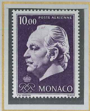
10 F VIOLET