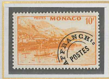
10 F JAUNE-ORANGE