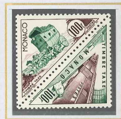
100 F LILAS - BRUN ET VERT DILIGENCE - WAGON