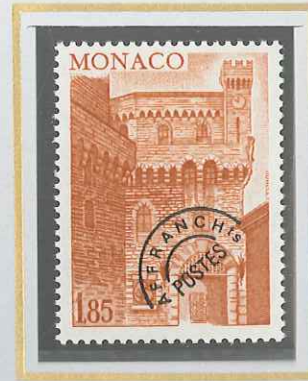
1,85 BRUN - CLAIR