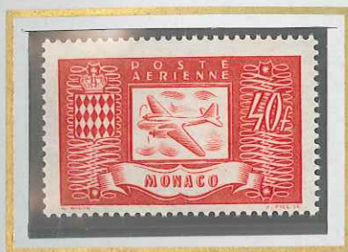
40 F ROUGE