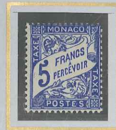
5 F OUTREMER