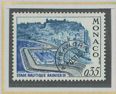
0,35 TURQUOISE, ARDOISE ET BLEU