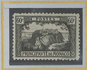
60 c GRIS-NOIR