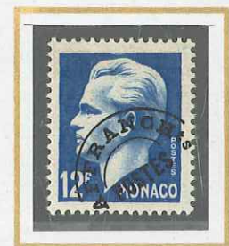
12 F BLEU CLAIR