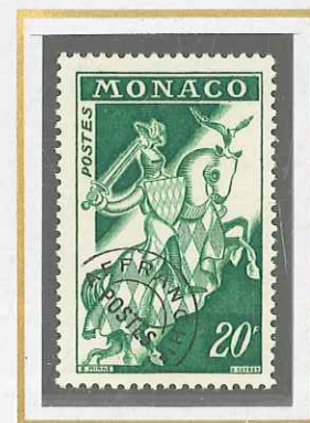
20 F VERT VIF