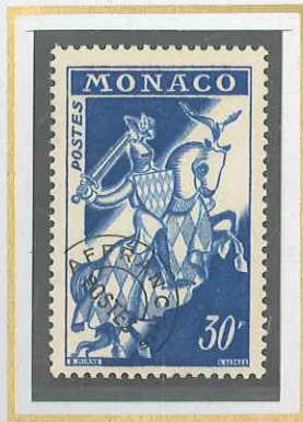
30 F BLEU CLAIR