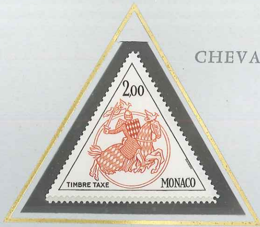
2 F BRUN FONCÉ - BRUN CLAIR