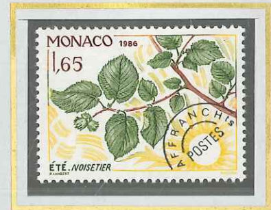
1 F 65 ÉTÉ