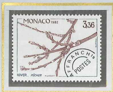
3 F 36 HIVER