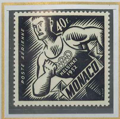
40 F NOIR