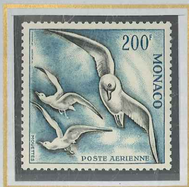
200 F BLEU-VERT & NOIR