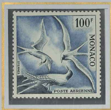
100 F BLEU-PALE & ARDOISE 1955