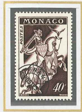
40 F BRUN - VIOLET