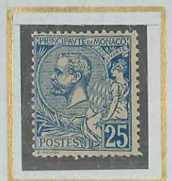
25 c BLEU