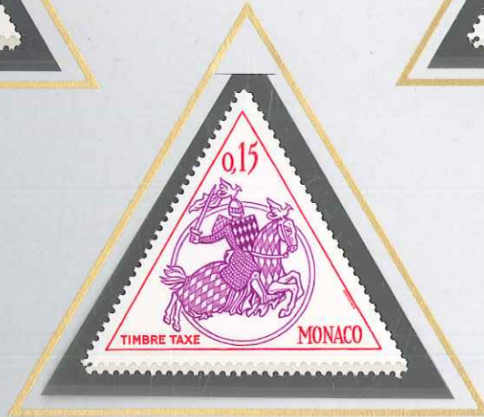
0,15 LILAS ET ROUGE