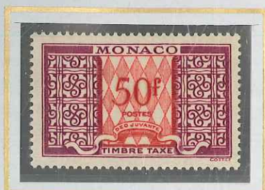
50 F CARMIN ET LILAS