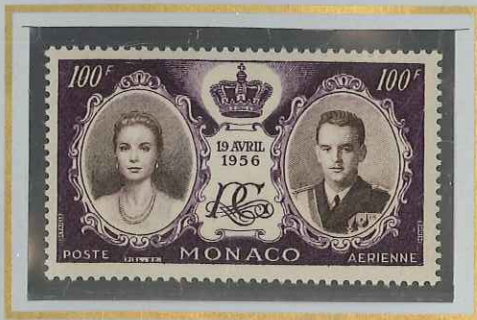
MARIAGE PRINCIER 100 F VIOLET & SÉPIA