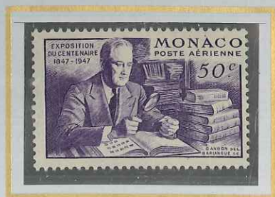
50 c VIOLET