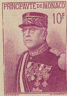
10 F LILAS ROSE