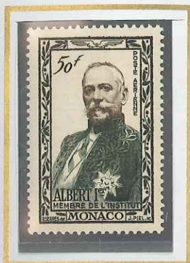
50 F VERT-NOIR & BRUN