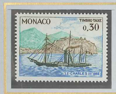
0,30 LE CHARLES III