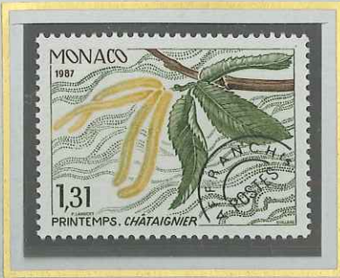
1 F 31 PRINTEMPS