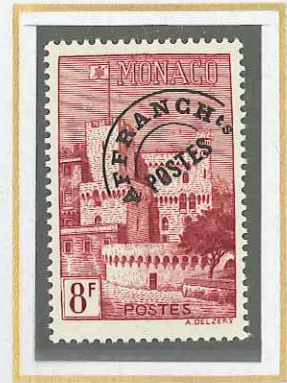
8 F BRUN CARMINE