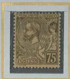
75c BRUN-OLIVE s. CHAMOIS