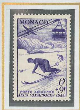
6 F + 9 F VIOLET