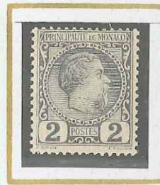
2 c VIOLET-GRIS