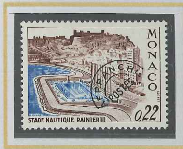
0,22 BRUN ET BLEU