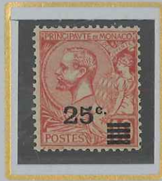
25 c s. 10 c