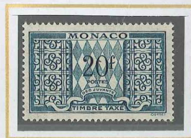
20 F VERT