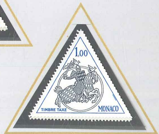
1 F VERT, NOIR ET BLEU