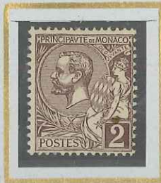
2 c VIOLET-BRUN