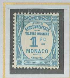
1 F BLEU-CLAIR