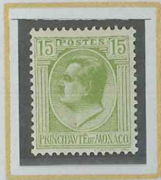
15 c VERT-JAUNE