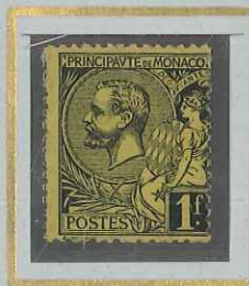
1 F NOIR s. JAUNE