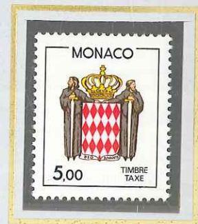
5 F ROUGE BRUN