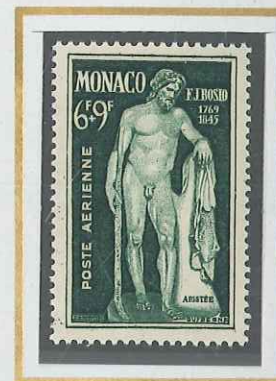
6 F + 9 F VERT-JAUNE