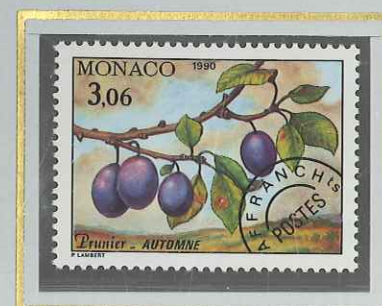
3 F 06 AUTOMNE