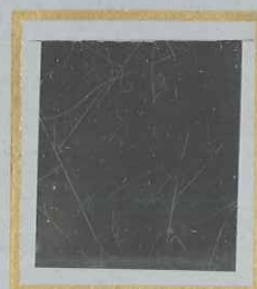
5 F + 5 F ROSE s. VERDATRE