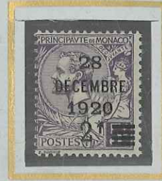
2 F s. 5 F VIOLET