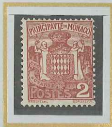
2 c BRUN-ROUGE