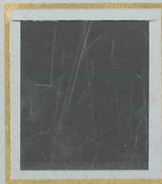
25 c VERT