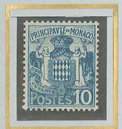
10 c BLEU CLAIR