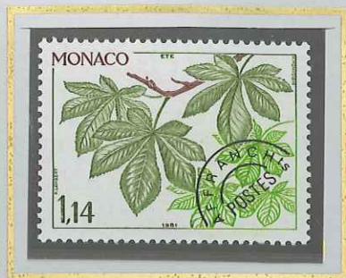
1 F 14 ÉTÉ