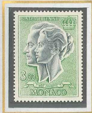
3 F VERT-JAUNE