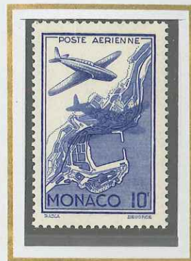
10 F OUTREMER