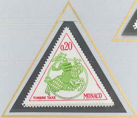
0,20 VERT ET ROUGE