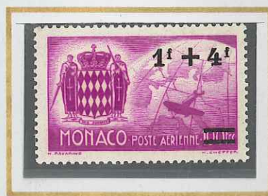
1 F + 4 F s. 100 F LILAS-ROSE