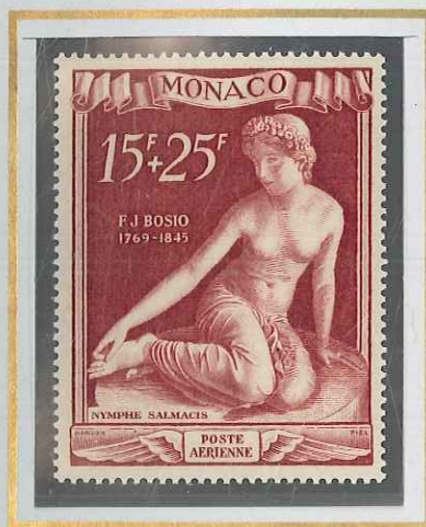
15 F + 25 F BRUN-ROUGE