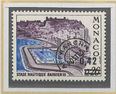
0,42 S. 0,26 VIOLET ET OUTREMER