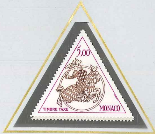
5 F LILAS - BRUN