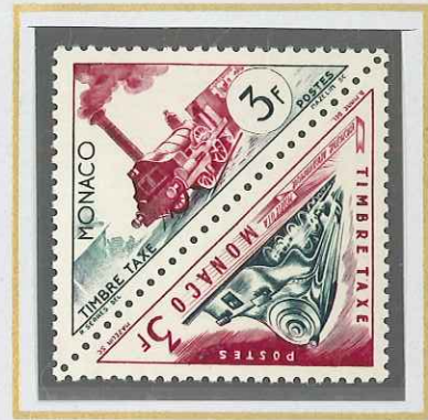
3 F VERT ET LILAS LOCOMOTIVES