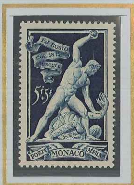
5 F + 5 F BLEU ARDOISE