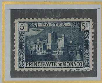
5 F VERT s. GRIS