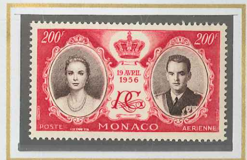
MARIAGE PRINCIER 200 F ROSE VIF & SÉPIA