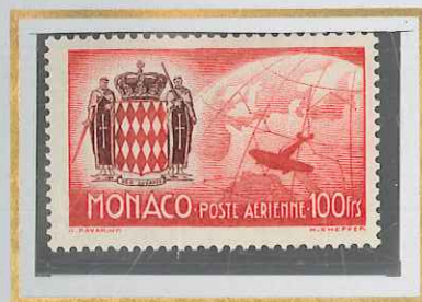
100 F ROUGE & BRUN