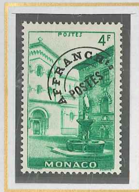
4 F VERT ÉMERAUDE