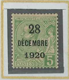
5 c VERT-JAUNE