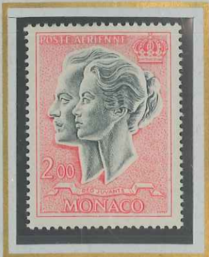
2 F ROSE