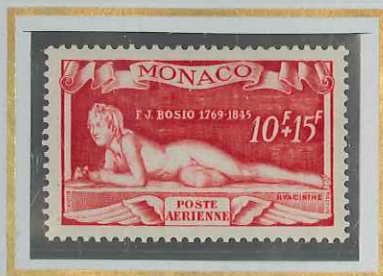
10 F + 15 F ROSE-CARMINÉ