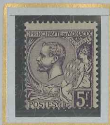
5 F VIOLET