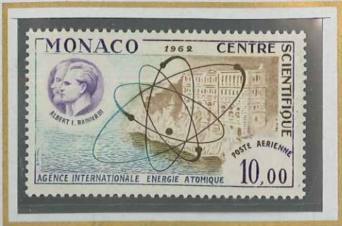
10 F CENTRE DE L'ÉNERGIE ATOMIQUE