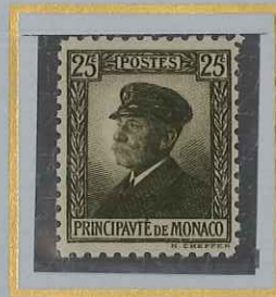
25 c BRUN-OLIVE