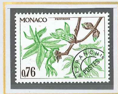
0,76 VERT ET BRUN