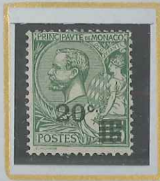
20 c s. 15 c