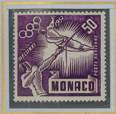
50 F VIOLET