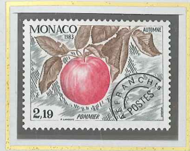
2 F 19 AUTOMNE