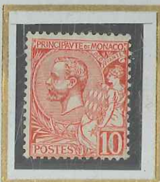
10 c ROUGE