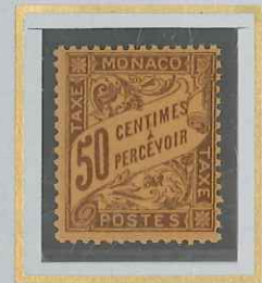
50c BRUN S. ORANGE