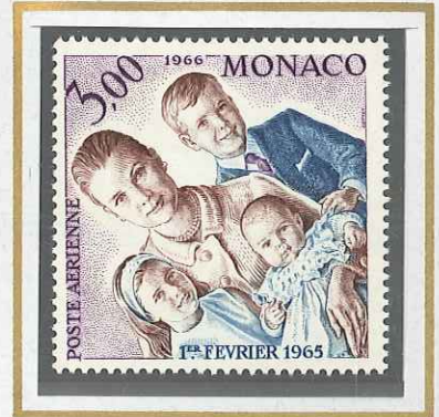
3 F PRINCESSE STÉPHANIE