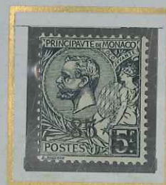
85 c s. 5 F