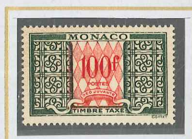
100 F VERT ET ROUGE