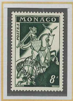
8 F VERT FONCÉ