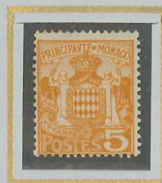
5 c JAUNE-ORANGE