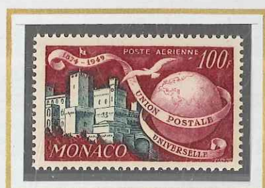
100 F LIE DE VIN & ARDOISE