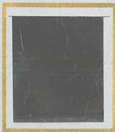
5 c BLEU