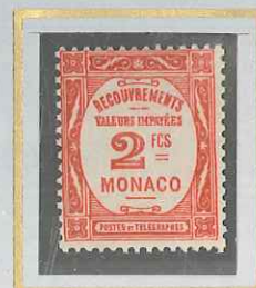
2 F ROUGE