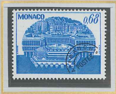
0,68 BLEU - CIEL