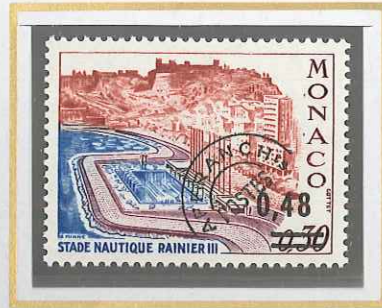
0,48 S. 0,30 BRUN, BLEU ET LILAS