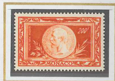
200 F ORANGE