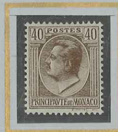
40 c SÉPIA