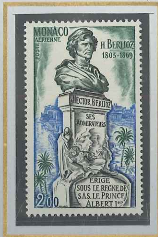
2 F HECTOR BERLIOZ