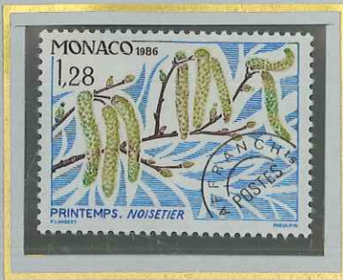
1 F 28 PRINTEMPS