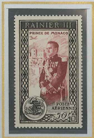
PRINCE RAINIER III 50 F NOIR & CARMIN