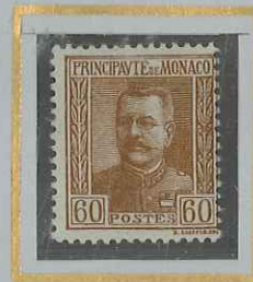
60 c BRUN CLAIR