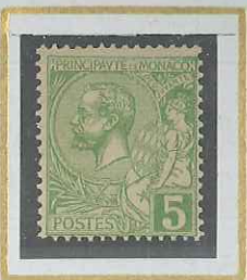
5 c VERT-JAUNE