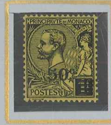
50 c s. 1 F