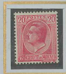
20 c ROSE