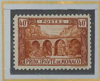
40 c BRUN-ROUGE