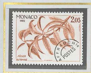
2 F 03 AUTOMNE