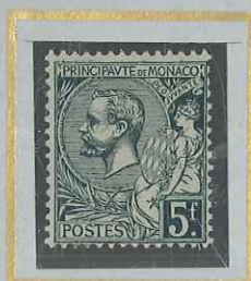
5 F VERT-GRIS FONCÉ