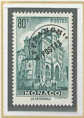
80 c VERT-BLEU