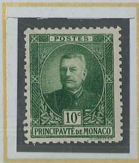
10 c VERT