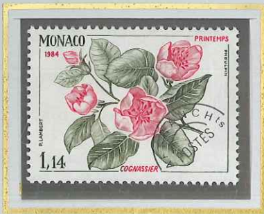
1 F 14 PRINTEMPS