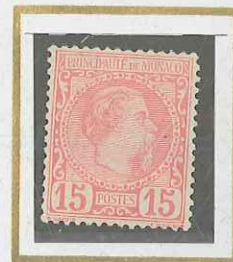
15 c ROSE