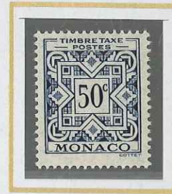
50 c BLEU