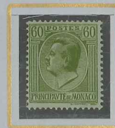
60 c OLIVE s. VERDATRE