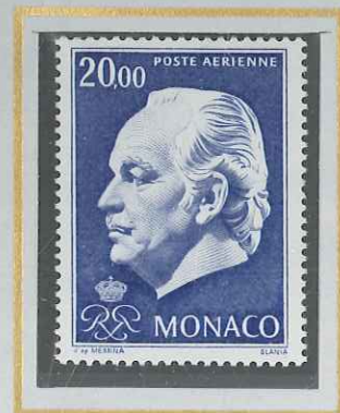
20 F OUTREMER VIF