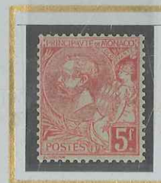
5 F ROSE VIP s. VERDATRE