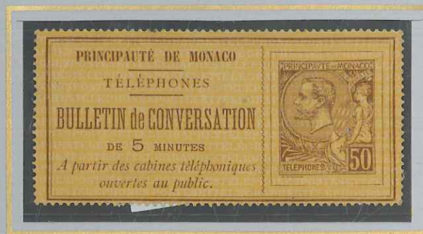
50c BRUN SUR JAUNE-OR