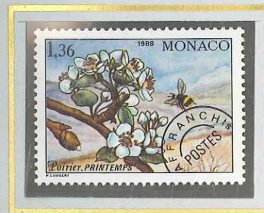
1 F 36 PRINTEMPS