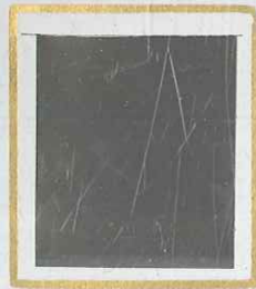
1 F NOIR s. JAUNE