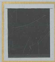
5c + 5c s. 5F + 5F