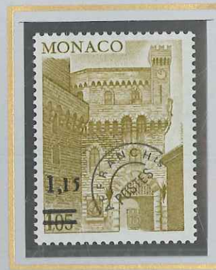
1,15 S. 1,05 BISTRE