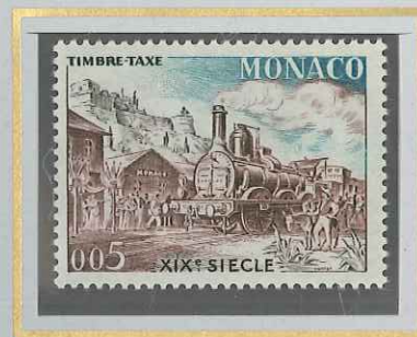
0,05 TRAIN XIX e SIÈCLE