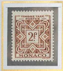
2 F BRUN-JAUNE