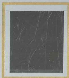
1 F + 1 F NOIR s. JAUNE