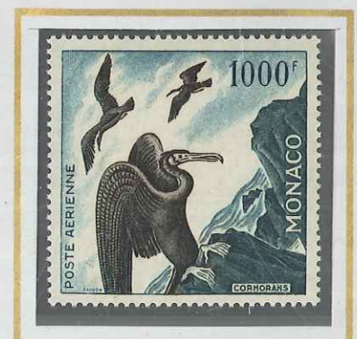
1000 F BLEU, BRUN-NOIR & VERT