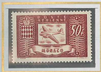
50 F BRUN