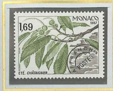
1 F 69 ÉTÉ