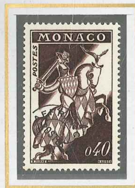
0,40 BRUN - VIOLET