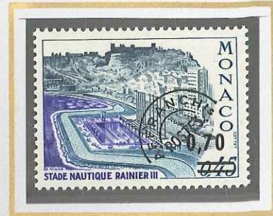
0,70 S. 0,45 ARDOISE, VIOLET ET VERT