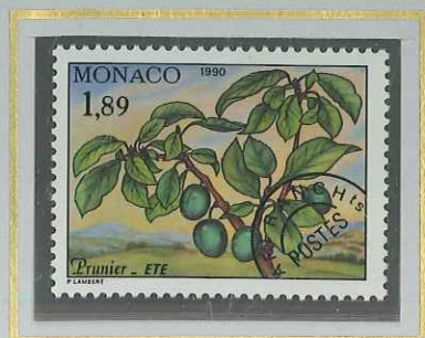
1 F 89 ÉTÉ