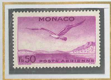
50 F LILAS-ROSE