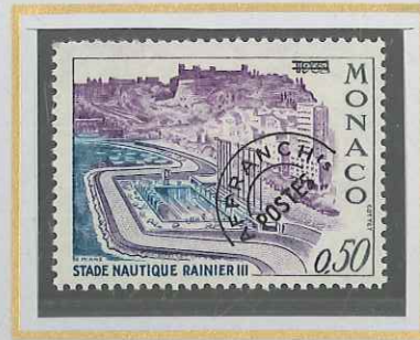
0,50 GRIS, VIOLET, TURQUOISE