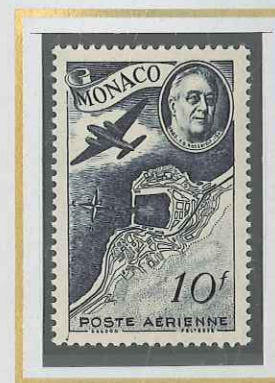
10 F GRIS-NOIR