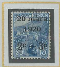
2c + 3c s. 25c + 15c