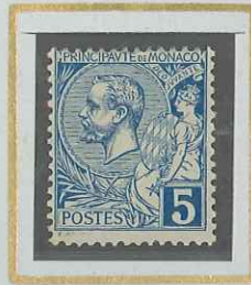
5 c BLEU