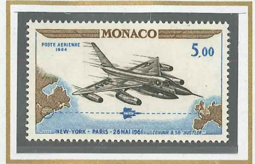
5 F VOL NEW YORK-PARIS