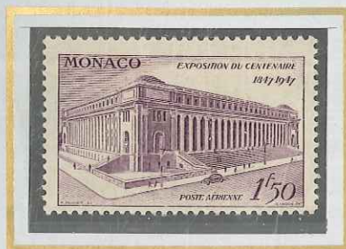
1 F 50 LILAS