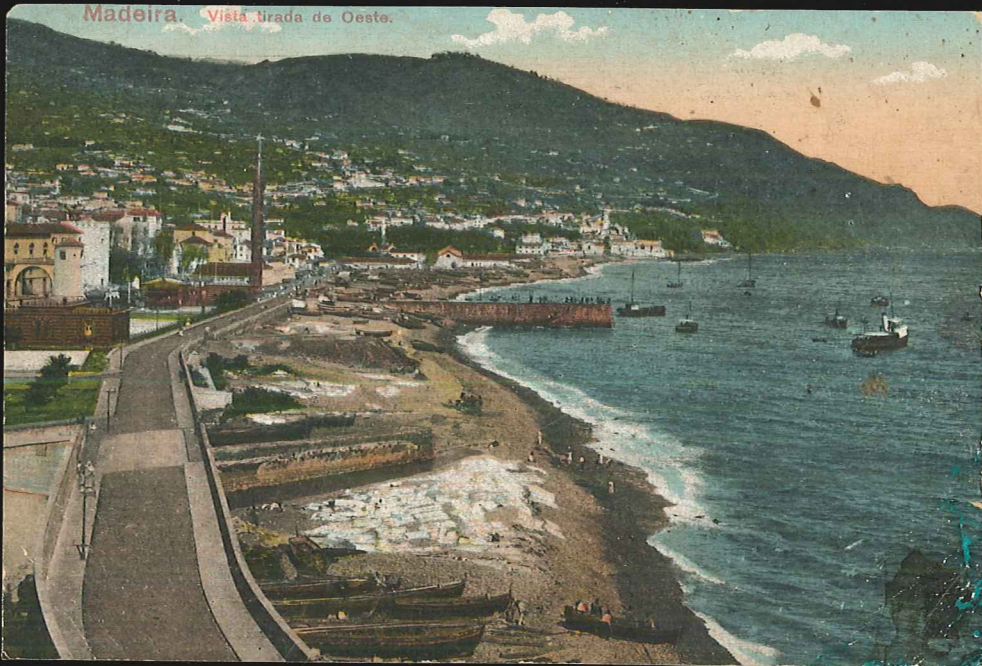
Madeira. Vista brada do Oeste.