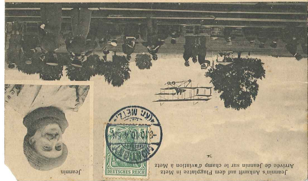
Jeanini's Ankunft auf dem Flugplatz in Metz