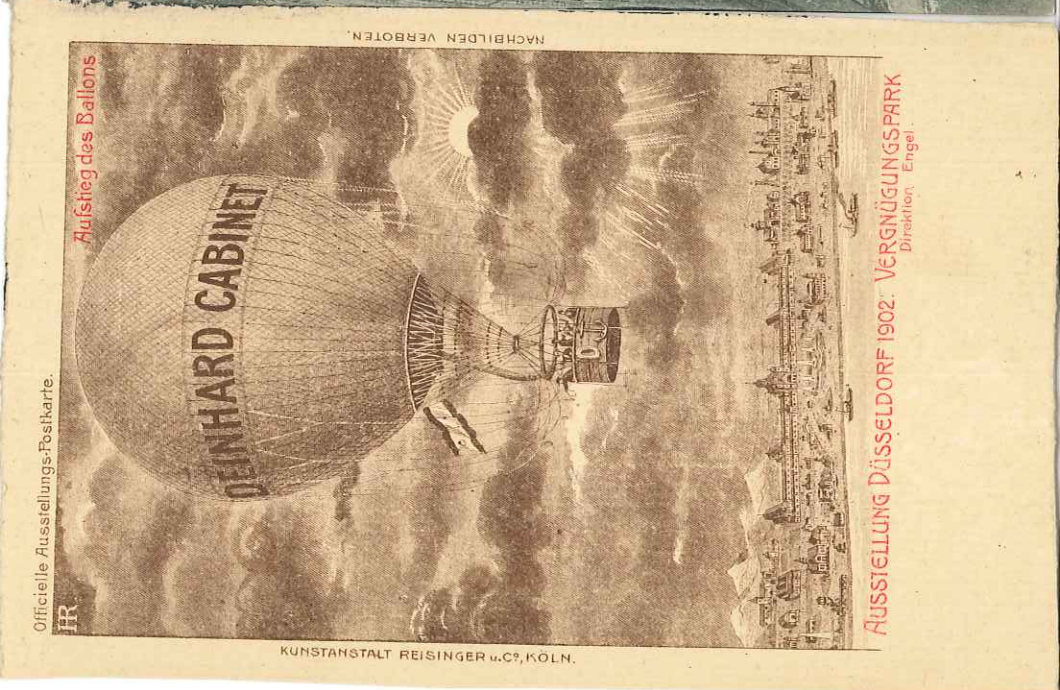
Aufstieg des Ballons

Wettermfliegen Grier-Metz - Concours d'aviation Grèves-Metz, 25. Sept. - 2. Okt. 1910