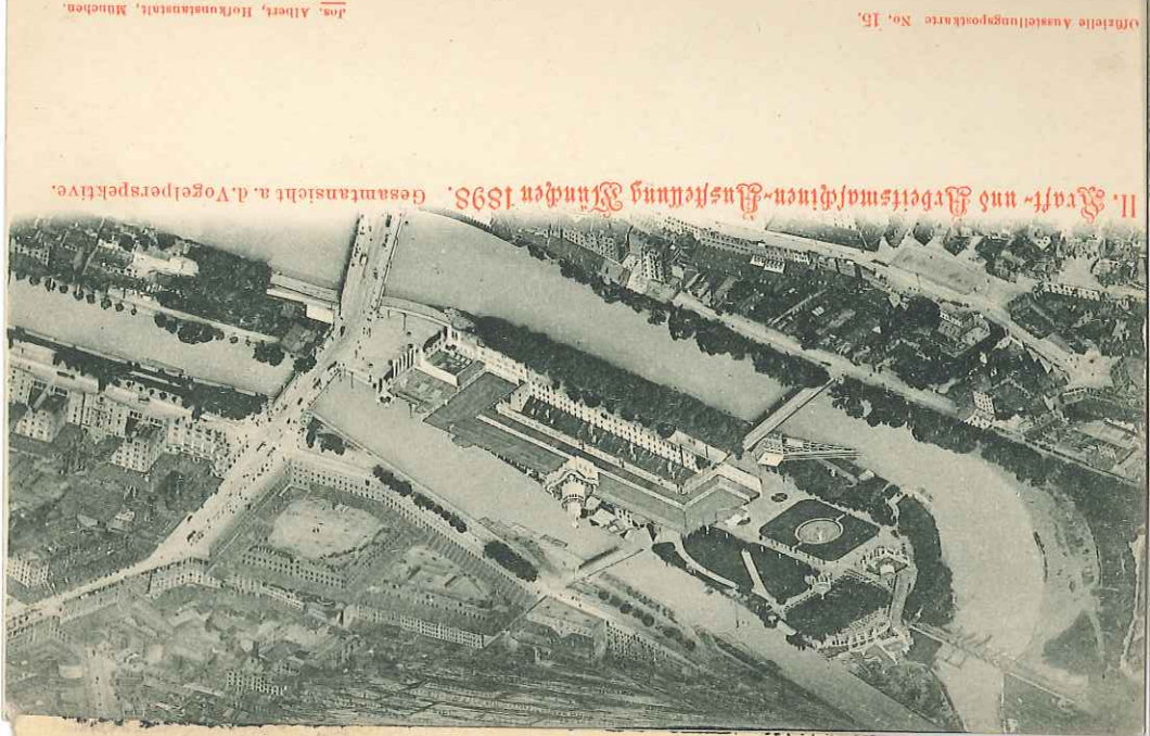
II. Kraft- und Arbeitsmaschinen-Ausstellung München 1898. Gesamtansicht n. d. Vogelperspektive.