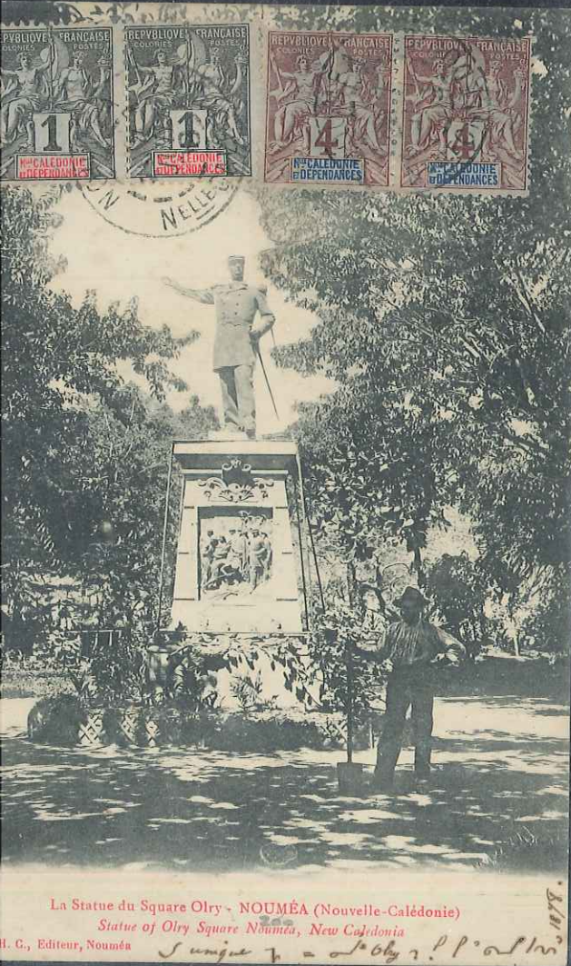
La Statue du Square Olry - NOUMÉA (Nouvelle-Calédonie) Statue of Olry Square Nouméa, New Caledonia