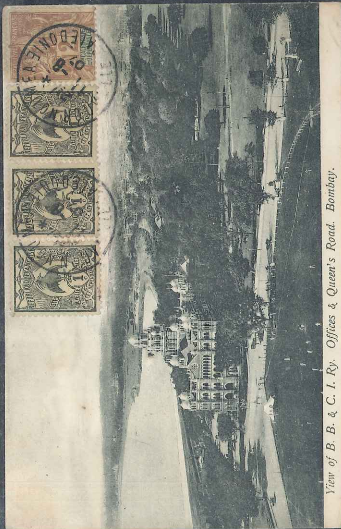
View of B. B. & C. I. Ry. Offices & Queen's Road. Bombay.