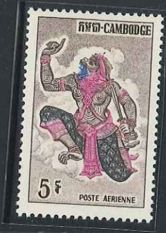
1964 – N° 19 à 23 Singes hanuman