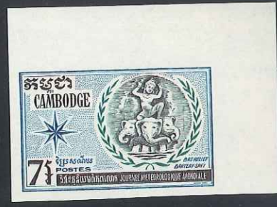
1970 – N° 252 à 254 Anniversaire ONU