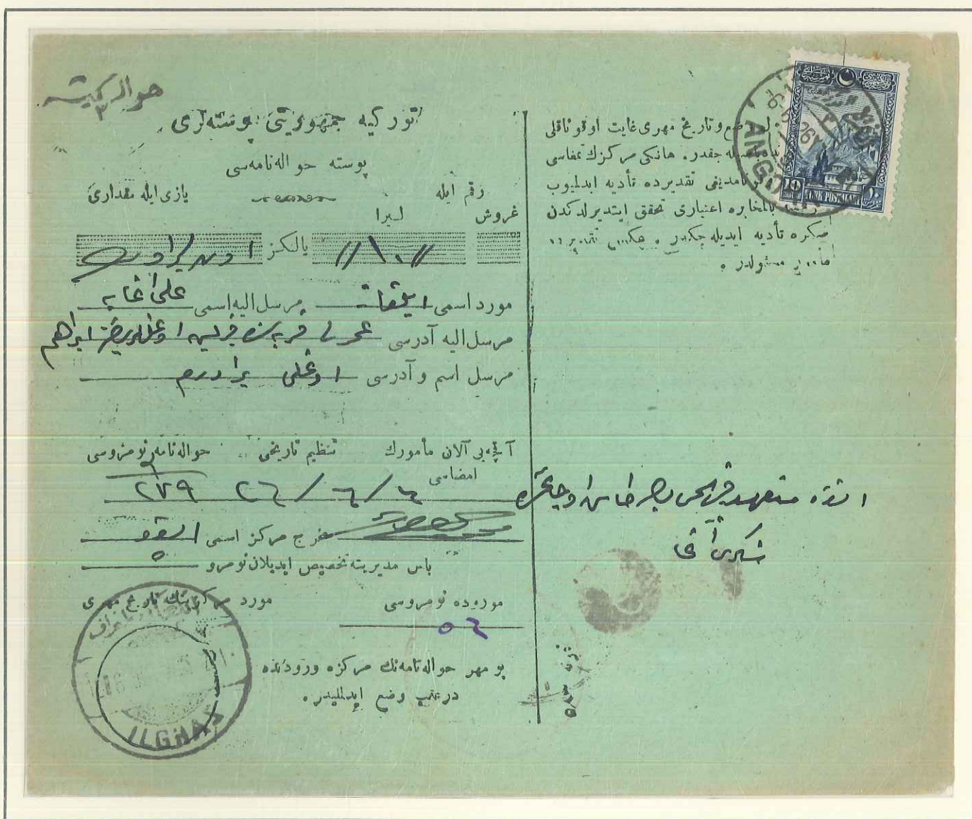
06. Juni 1926, Postanweisung über 10 Lira von Angora nach Ilghaz. Gebühr 10 Piaster.

Das "Z" des Städtenamens im Ankunftstempel ist spiegelverkehrt eingesetzt. Die Marke ist, wie vorgeschrieben, zusetzlich mit Scherenschnitt entwertet.